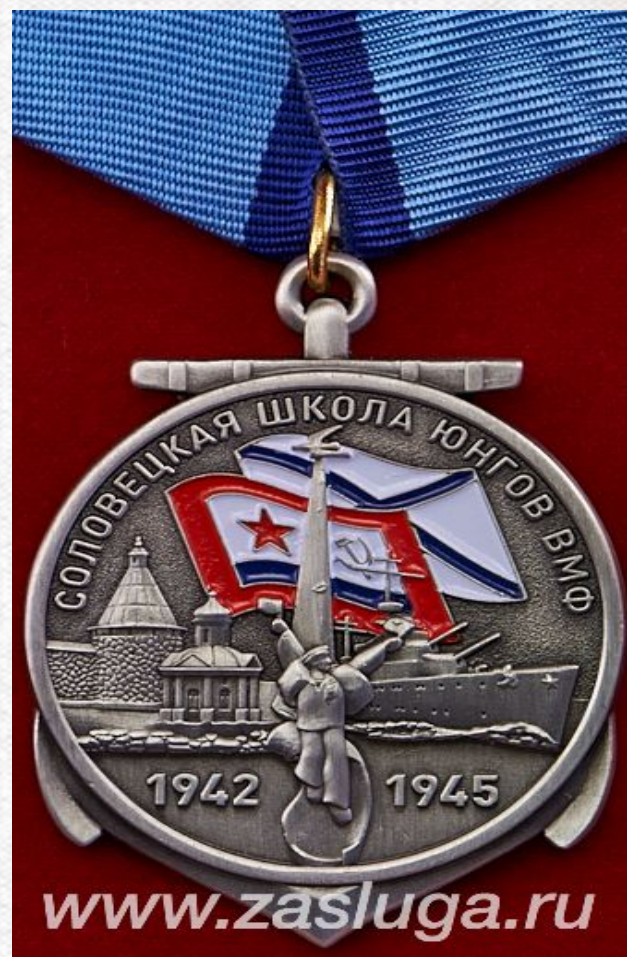
Медаль участника соловецкой школы юнг

Мы клянёмся до полного разгрома и уничтожения врага не знать отдыха, не знать покоя, быть в первых рядах самых мужественных, самых смелых, самых храбрых советских моряков. Если ослабнет воля, если подведу товарищей, если трусость постигнет в бою, то пусть презирают меня в веках, пусть покарает меня суровый закон Родины».