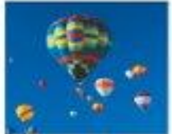
Мал. 34. Фізичні явища