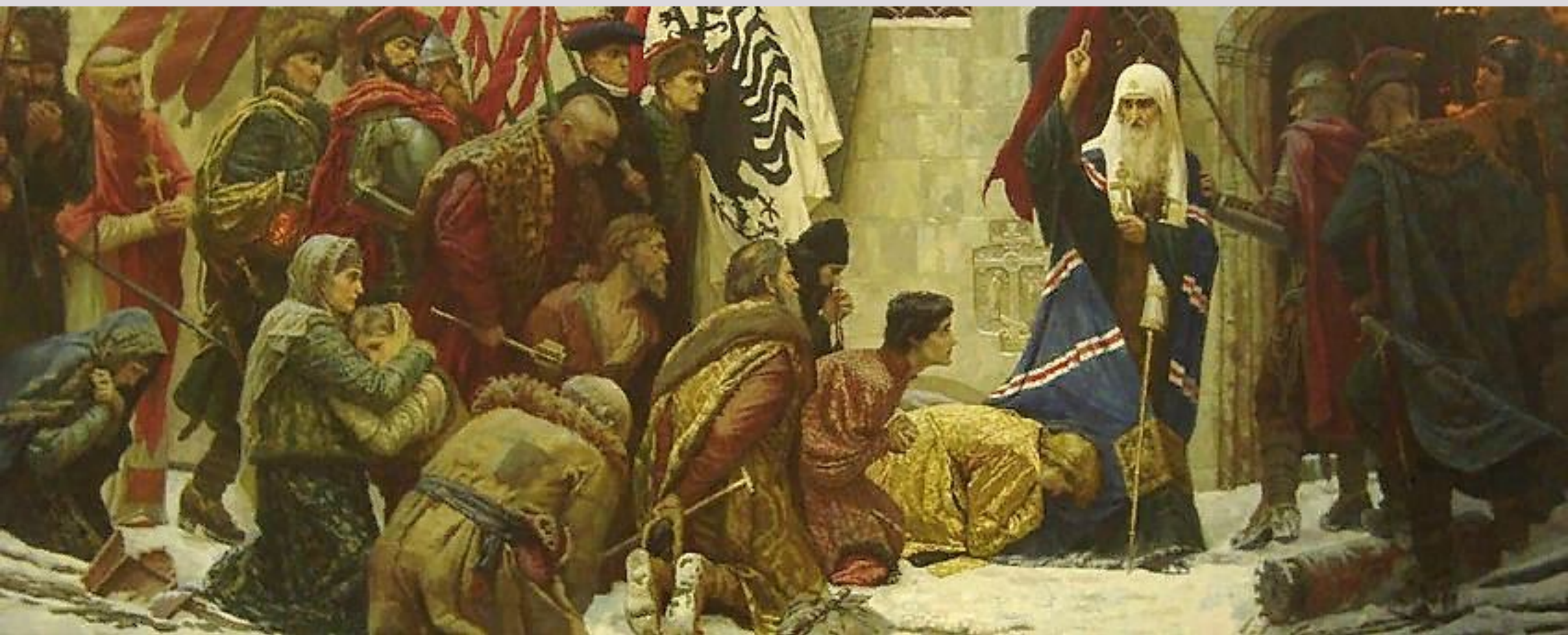
Святого Гермогена ведут в темницу. Вячеслав Моргун, 2008