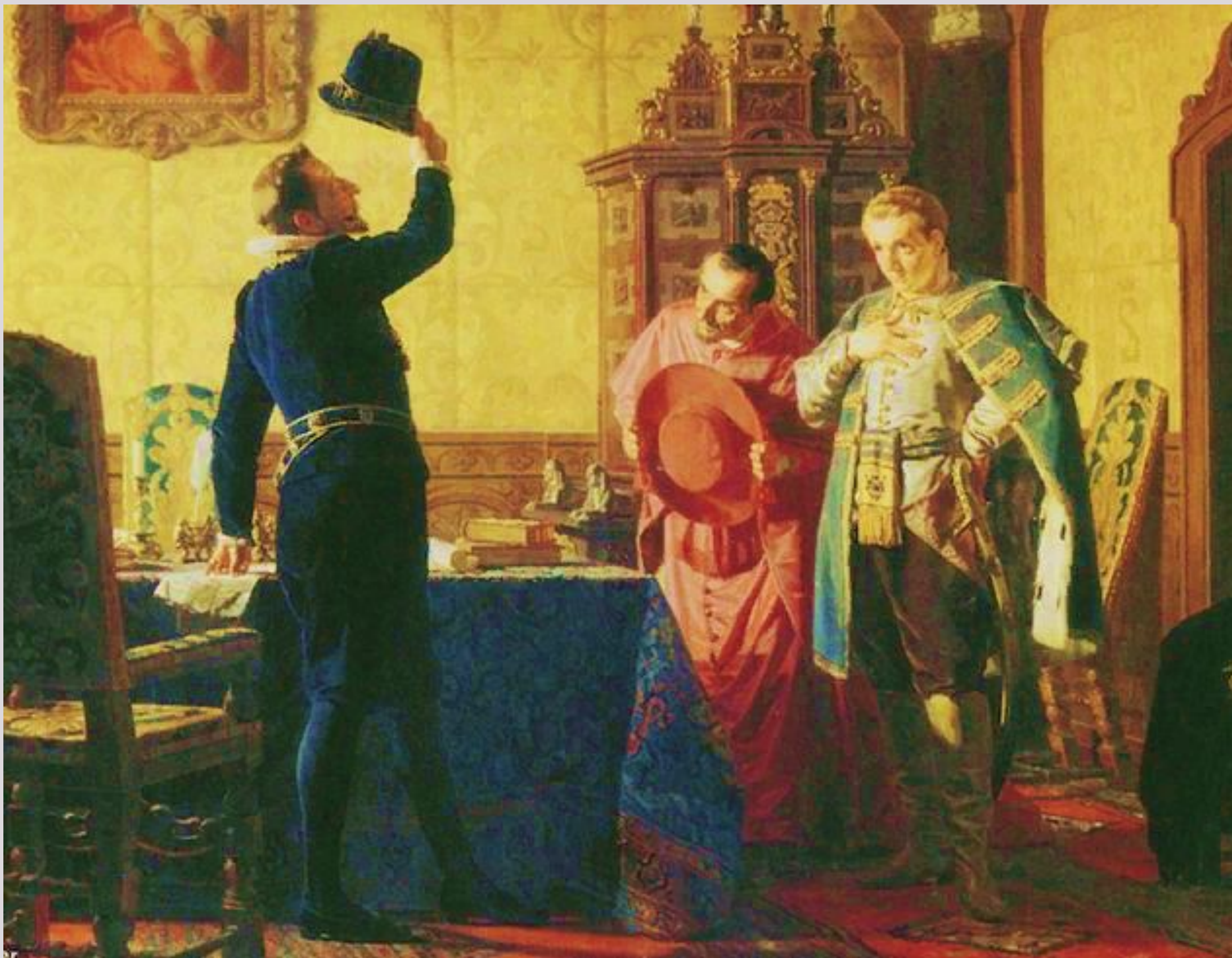
Присяга Лжедмитрия I польскому королю Сигизмунду III . Николай Неврев, 1874 г.