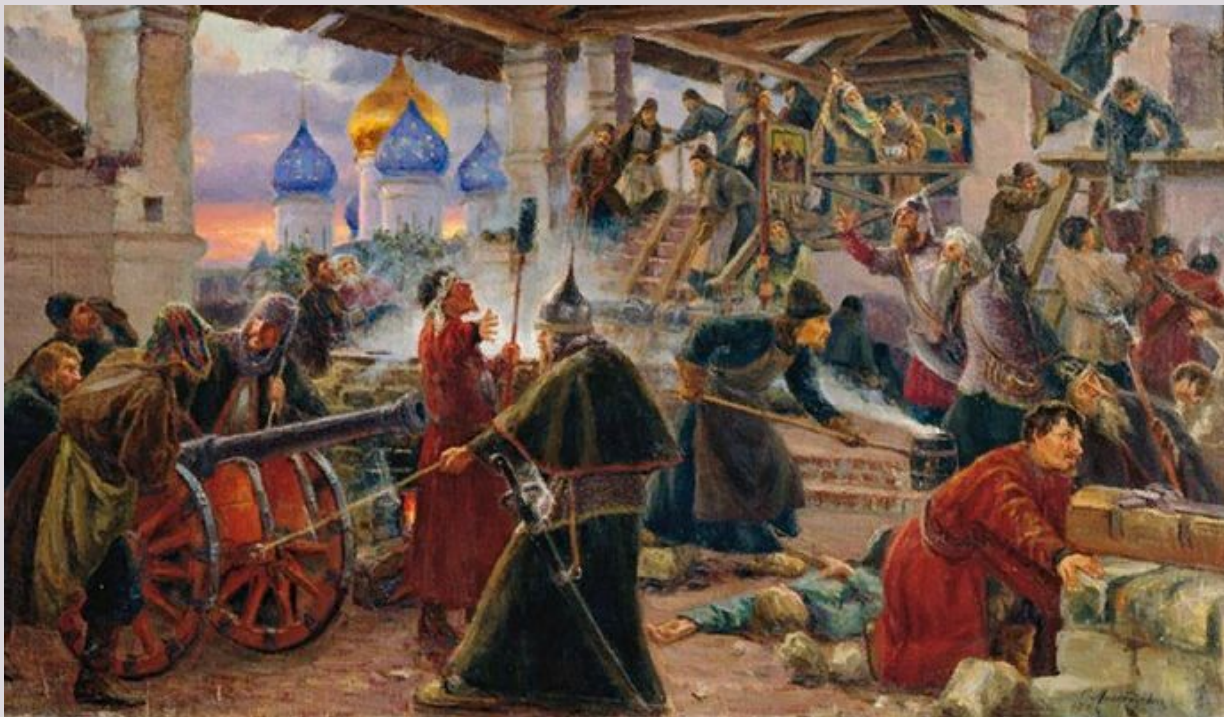
Оборона Троице-Сергиевой лавры. Сергей Милорадович, 1894