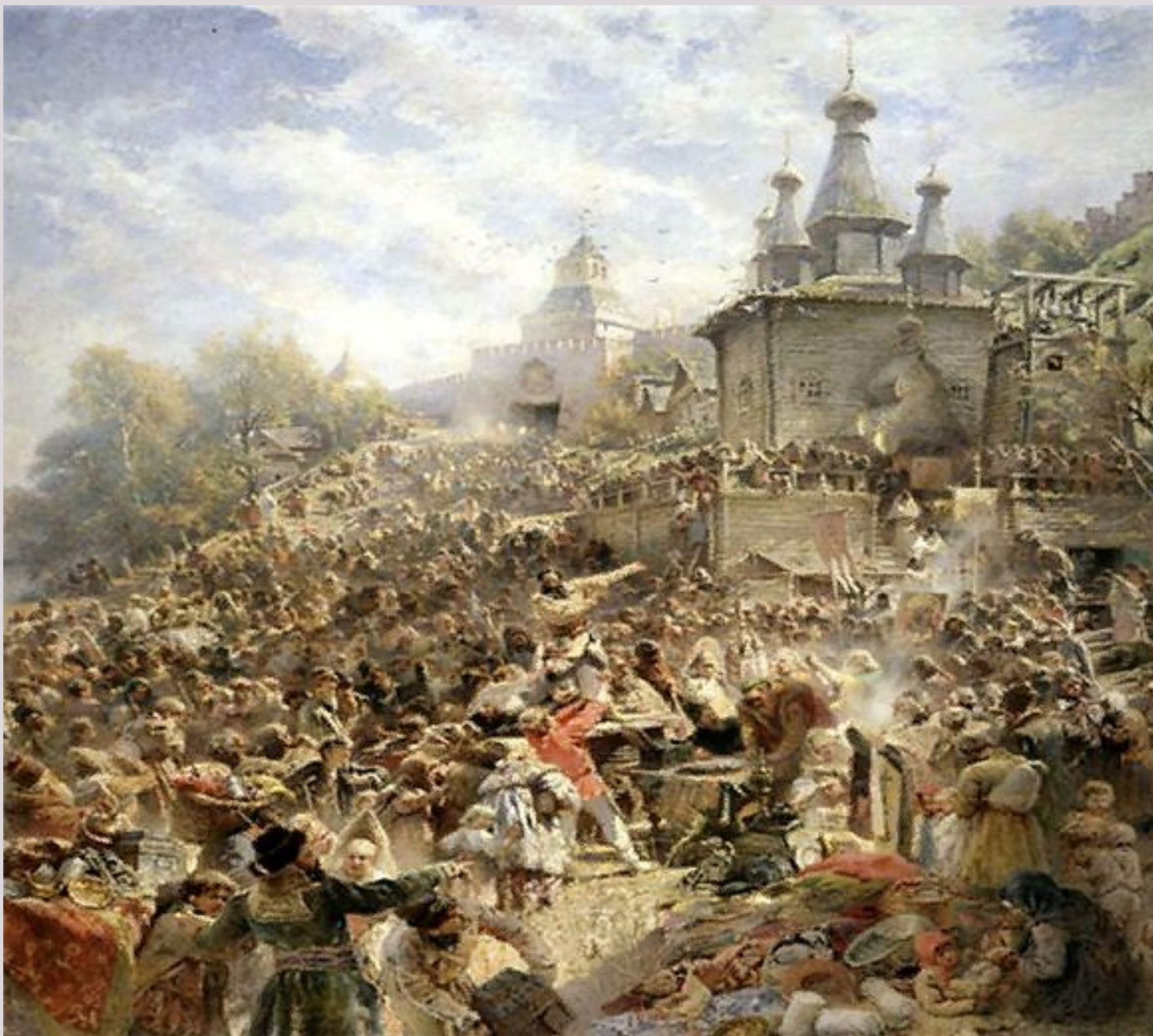
Минин на площади Нижнего Новгорода, призывающий народ к пожертвованиям.