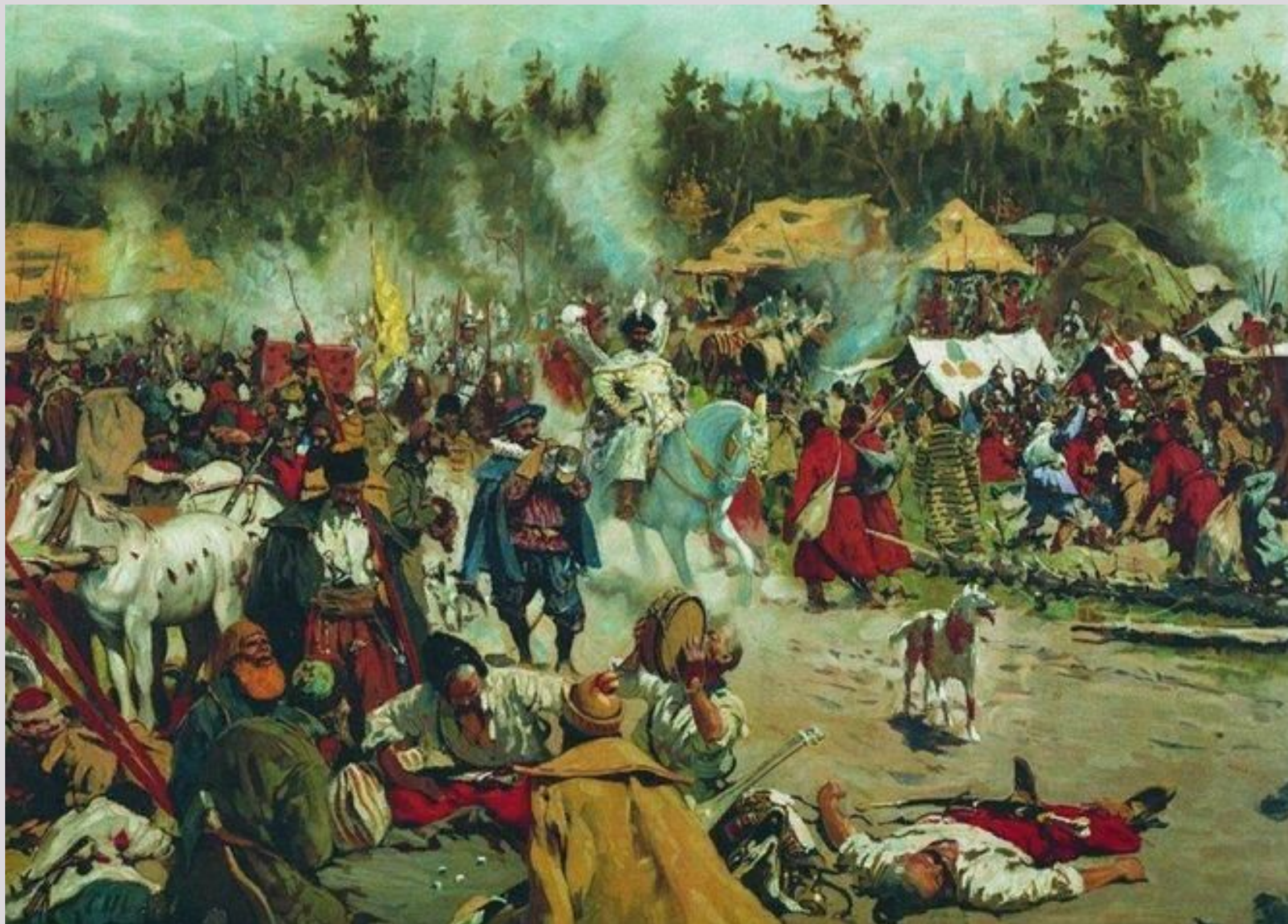
В Смутное время. Сергей Иванов, 1908