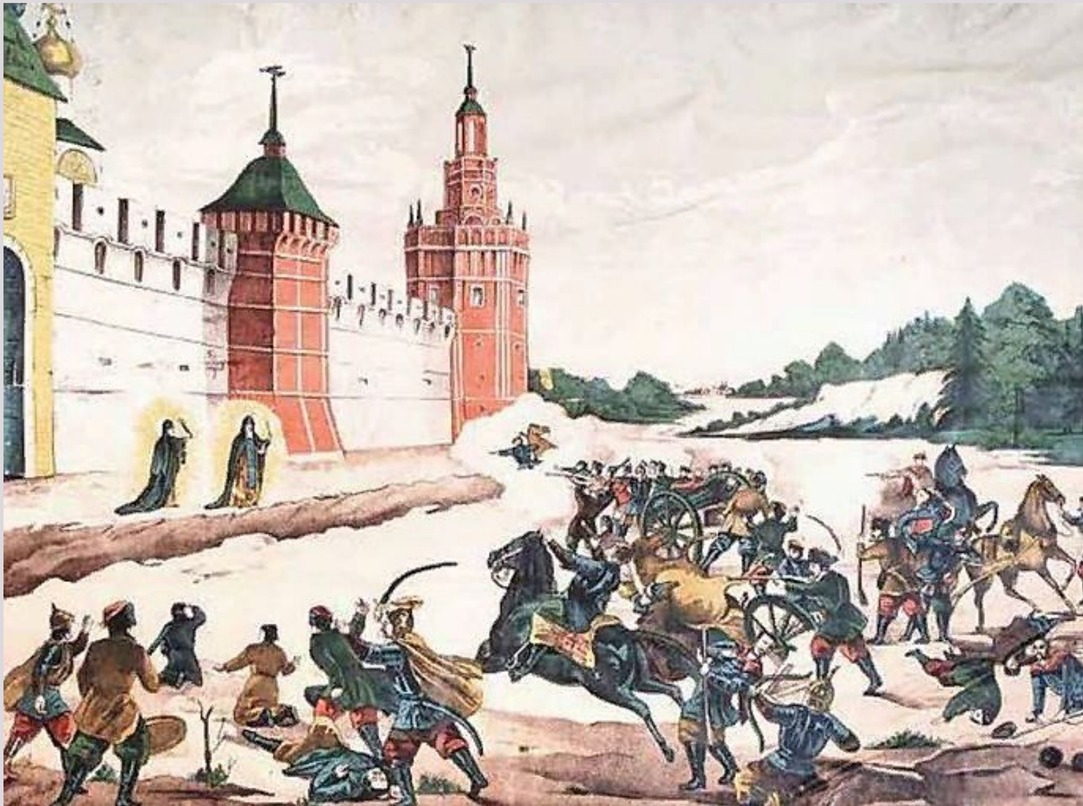
Осада Троицкого монастыря. Явление преподобного Сергия и Никона врагам. Литография. XIX век