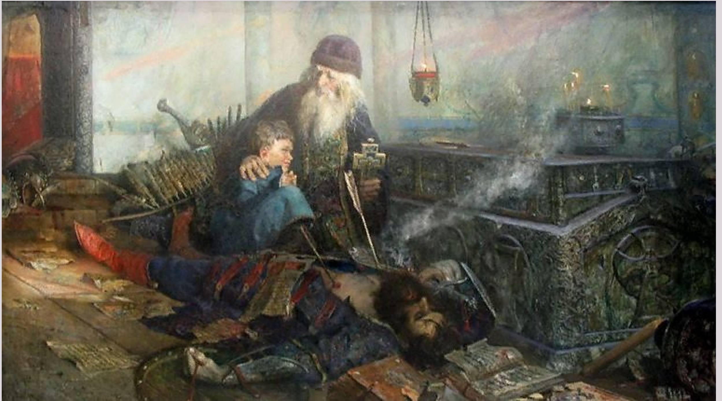
Смутное время. Павел Рыженко, 2003