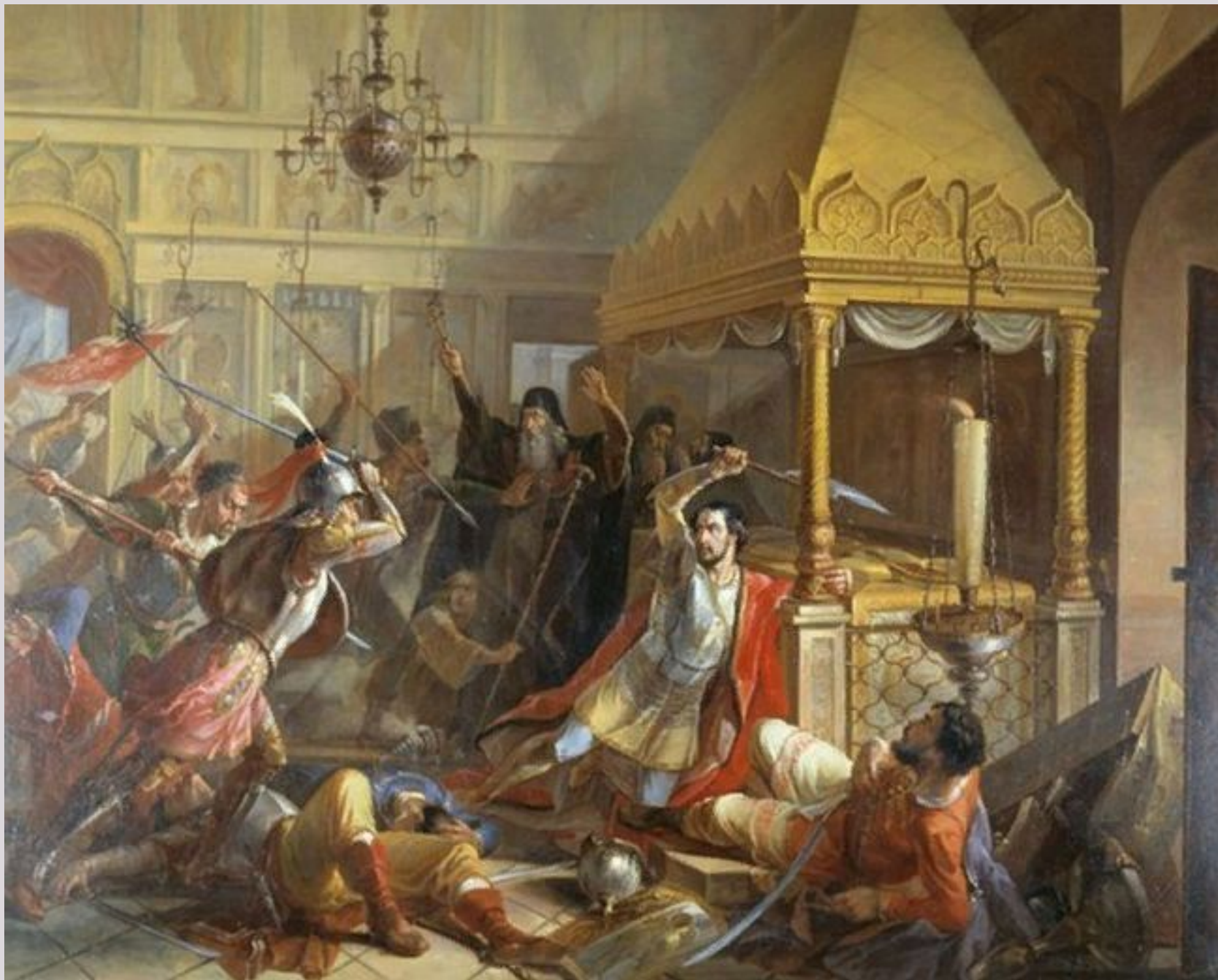
Предсмертный подвиг Михаила Константиновича Волконского. Василий Демидов, 1841