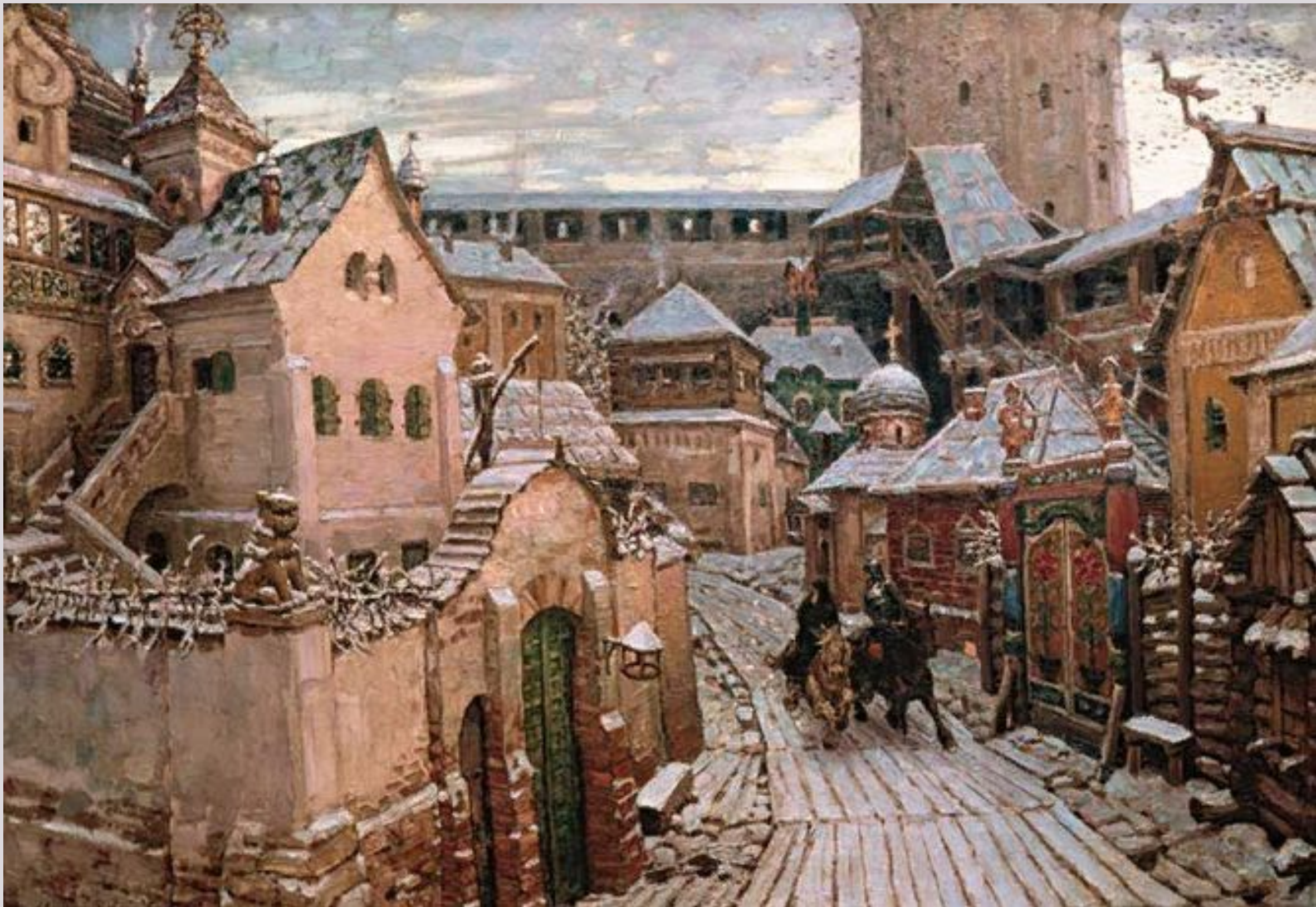
Гонцы. Ранним утром в Кремле. Начало XVII века. Аполлинарий Васнецов. 1913