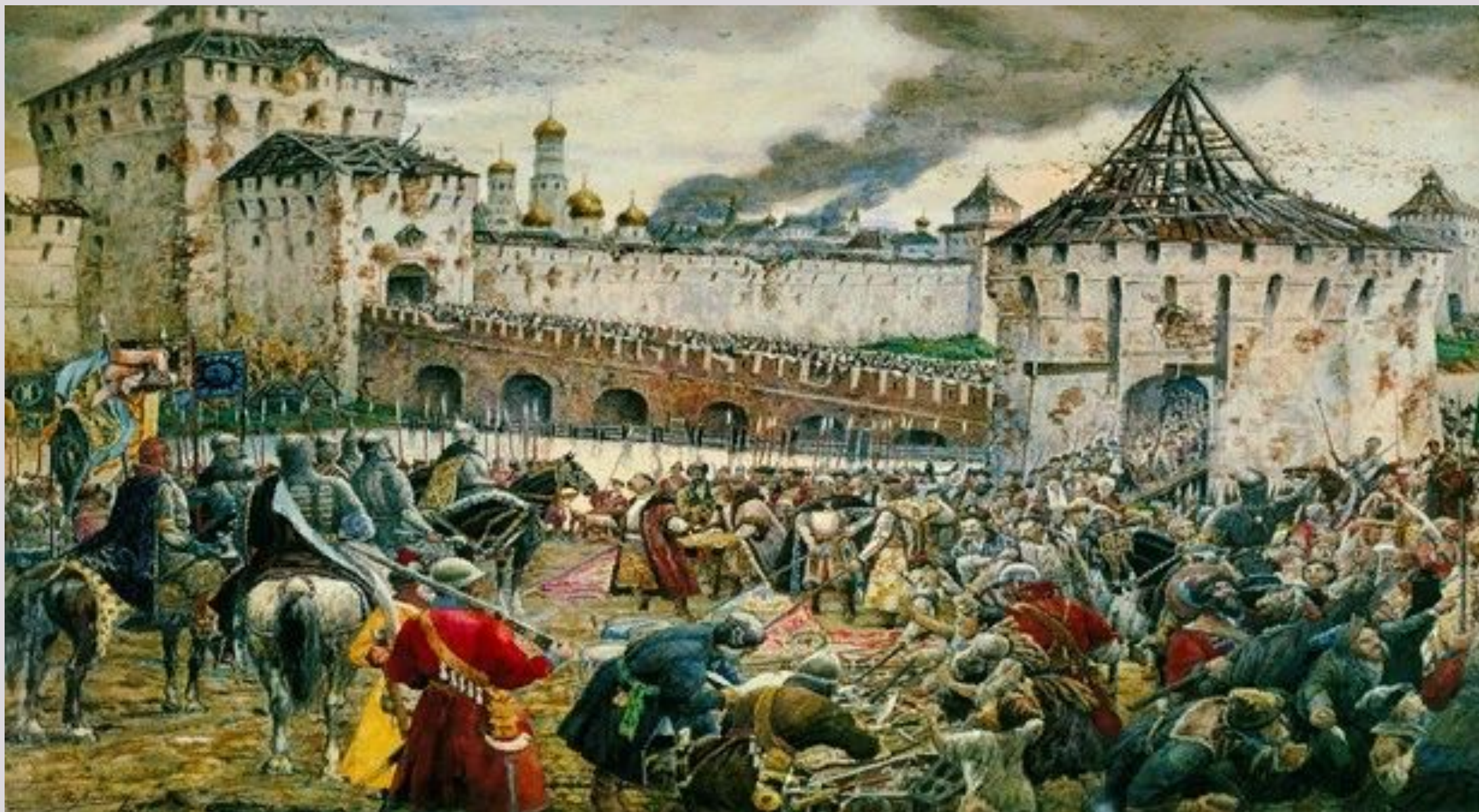
Изгнание польских интервентов из Московского Кремля. Эрнст Лисснер, 1908