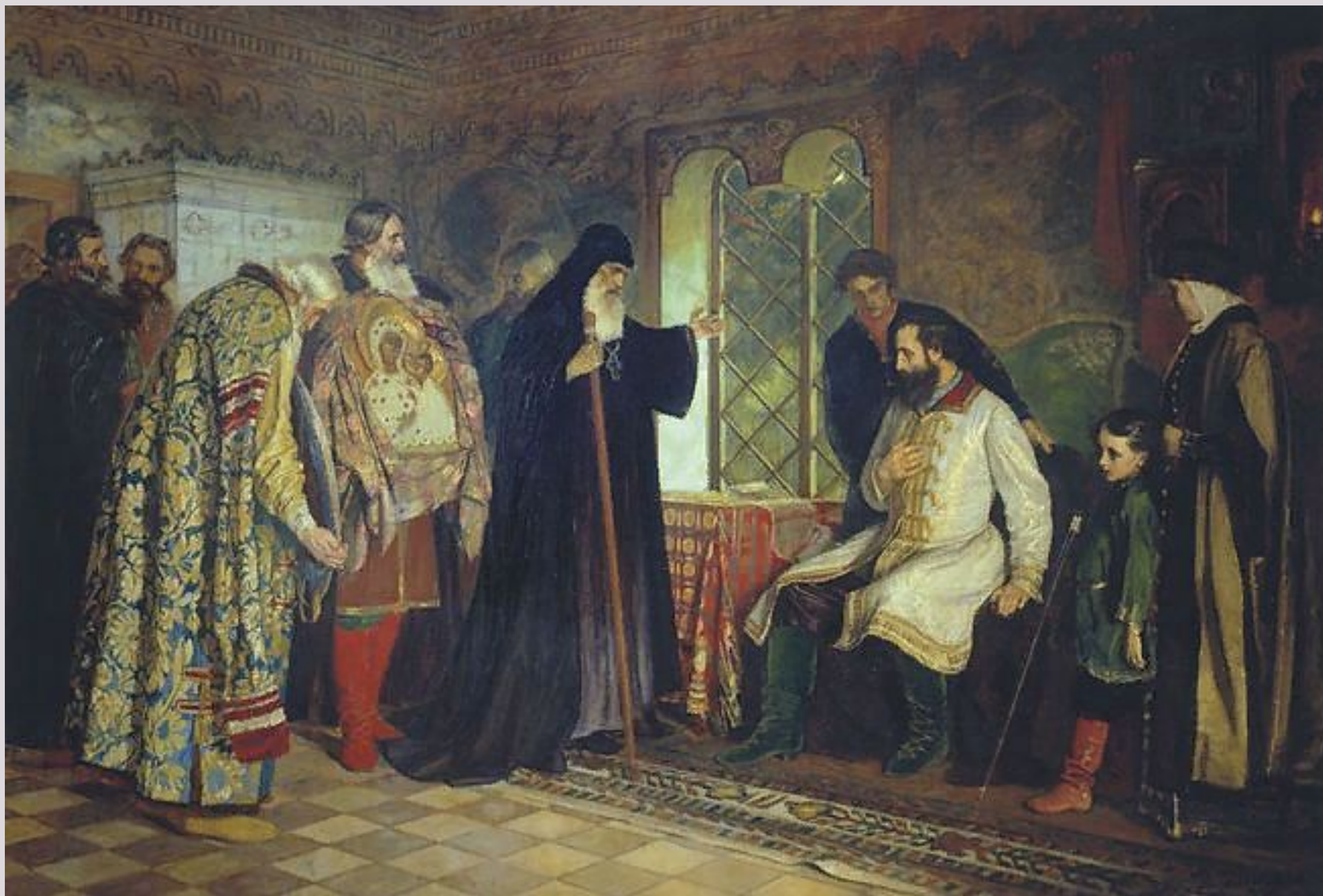
Нижегородские послы у князя Дмитрия Пожарского. Василий Савинский, 1882