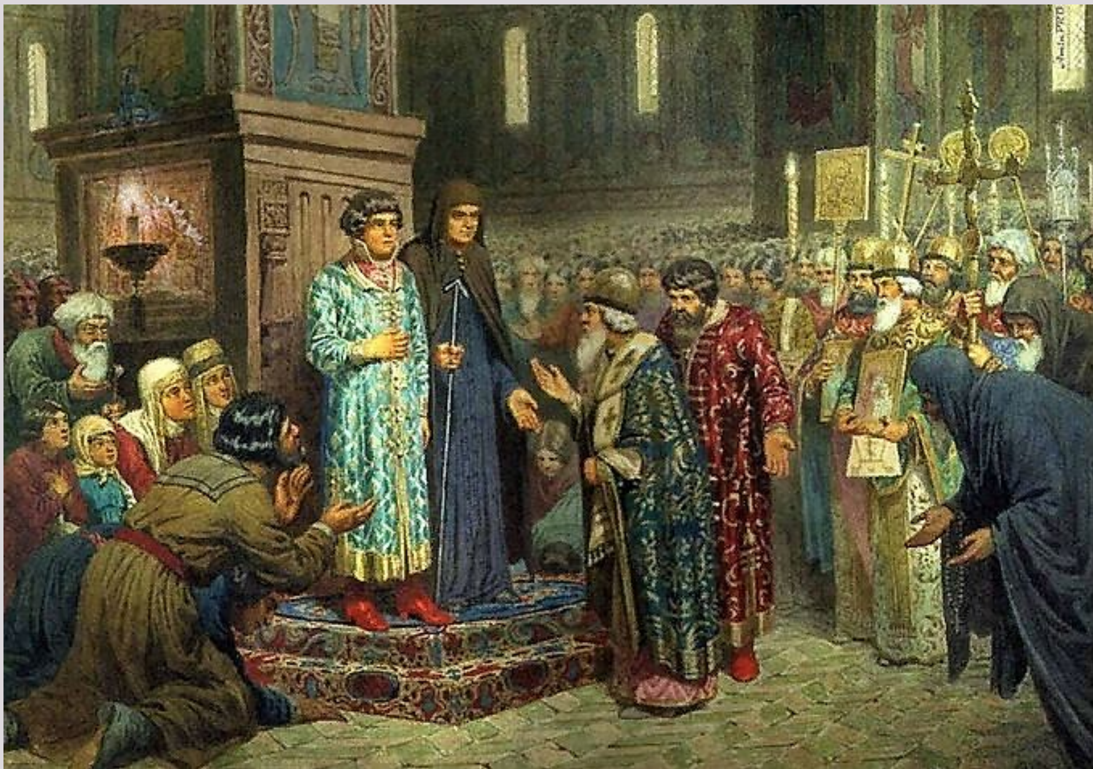
Михаил Федорович. Депутация от Земского собора. 21 февраля 1613 года Земский Собор избрал на царство Михаила Романова. Алексей Кившенко, 1880