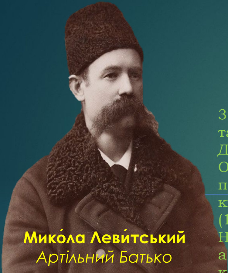
Мико́ла Леві́тський Артільний Батько

30 вересня 1894 на прохання своїх односельців із с. Федвар заснував там хліборобську артіль (це була перша у Російській імперії артіль). Допомагав організовувати ремісничі артілі також у містах, зокрема в Одесі, Миколаєві, Києві. 1899—1902 працював над розробкою закону про артілі в складі комісії при Міністерстві фінансів. Був делегатом кількох міжнародних конгресів з кооперації, які відбувалися у Франції (1896), Сербії (1898), Італії (1907), Швейцарії та Австрії (1909), Німеччині й Англії (1910). Левитського назвали «артільним батьком», а сам він запропонував 30-го вересня кожного року відзначати День кооперації.