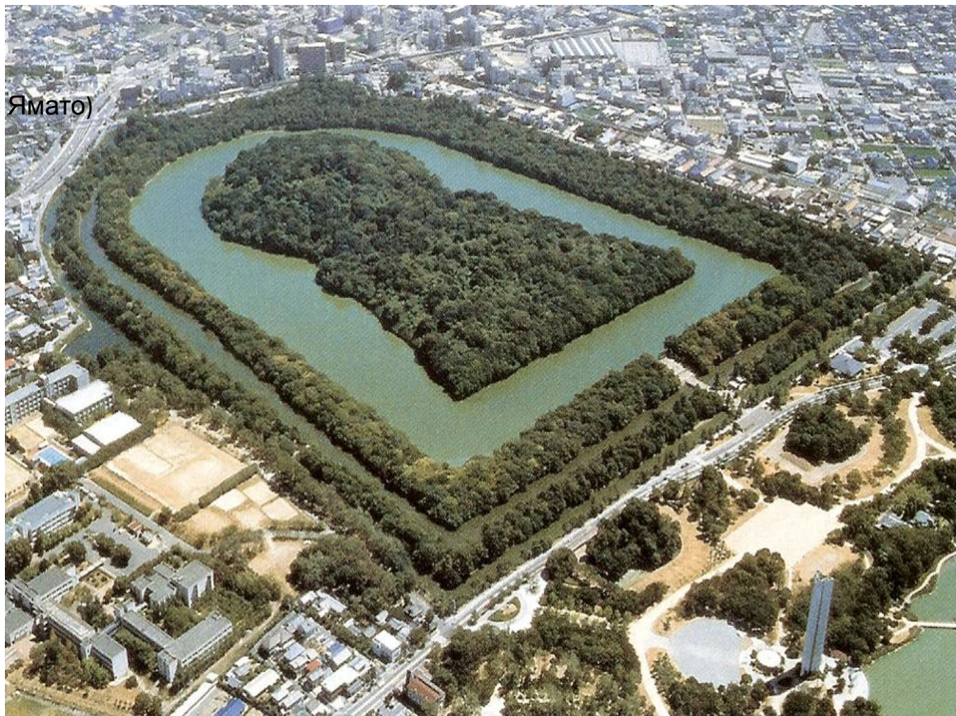
«Кофуны» (курганы князей Ямато)