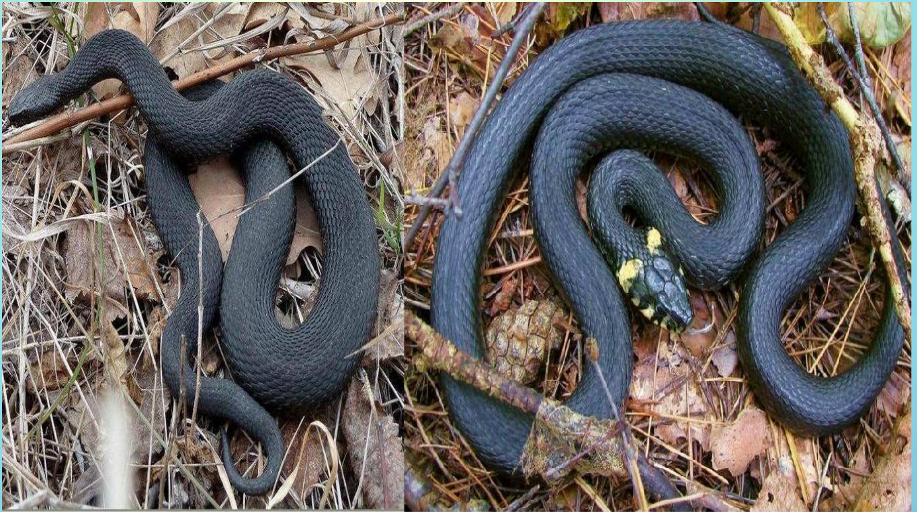
Слева гадюка, справа уж