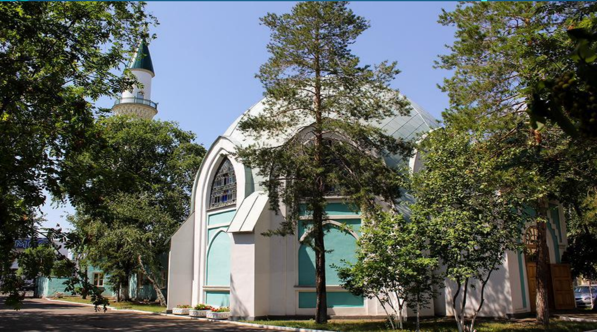
Общія видъ Караванъ-Сарач.