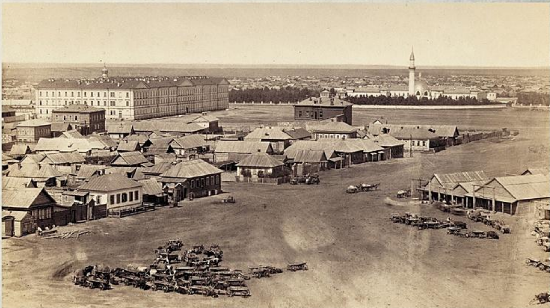
Хлебная, Соляная, Кадетская и Караван-Сарайская площади. Слева на заднем плане 1-й Неплюевский кадетский корпус, справа — Караван-Сарай. Вид с пожарной каланчи на Хлебной площади (ныне улица Гая)