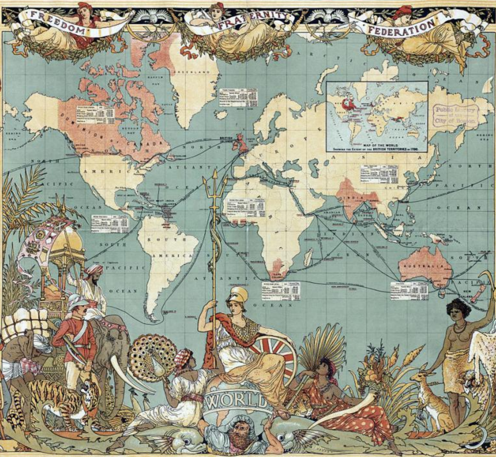
IMPERIAL FEDERATION—MAP OF THE WORLD SHOWING THE EXTENT OF THE BRITISH EMPIRE IN 1886.

STATISTICAL INFORMATION FURNISHED BY CAPTAIN J. C. R. COLVILLE, FORMERLY R.N.A. BRITISH TERRITORIES COLOURED RED