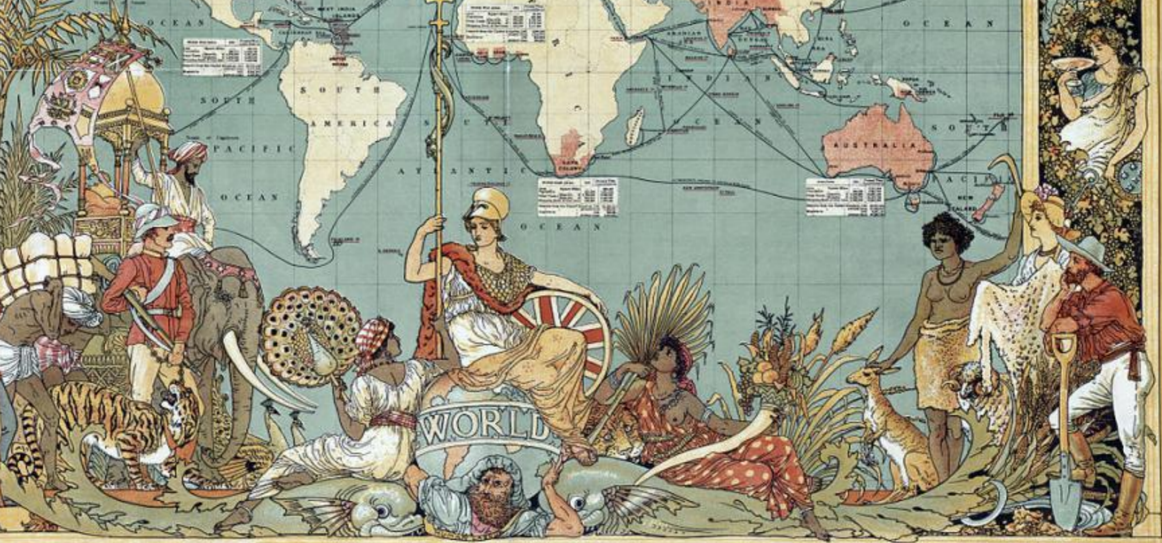
IMPERIAL FEDERATION —MAP OF THE WORLD SHOWING THE EXTENT OF THE BRITISH EMPIRE IN 1886. STATISTICAL INFORMATION FURNISHED BY CAPTAIN J. C. R. COLVILLE, FORMERLY R.N.A. BRITISH TERRITORIES COLOURED RED.