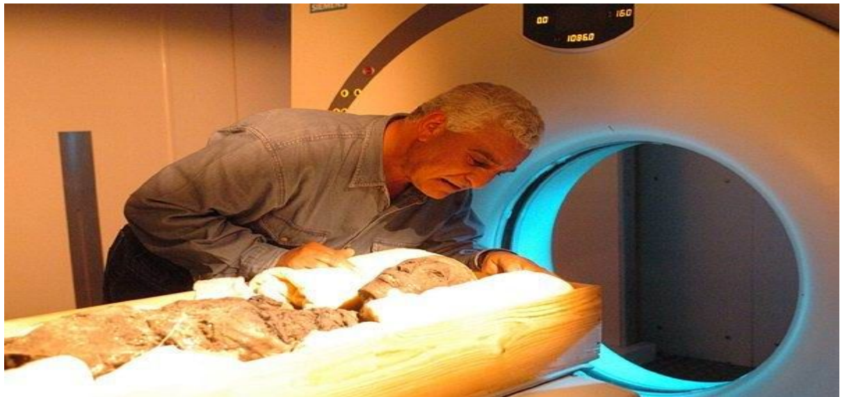
Учёный осматривает мумию.

Жители Египта стремились, чтобы тела фараонов а также других богатых и знатных людей сохранились такими же, какими были при жизни. Из тел умерших фараонов они делали мумии. Мумию делали так — из тела умершего фараона доставали все внутренности, а потом обматывали специальными бинтами.