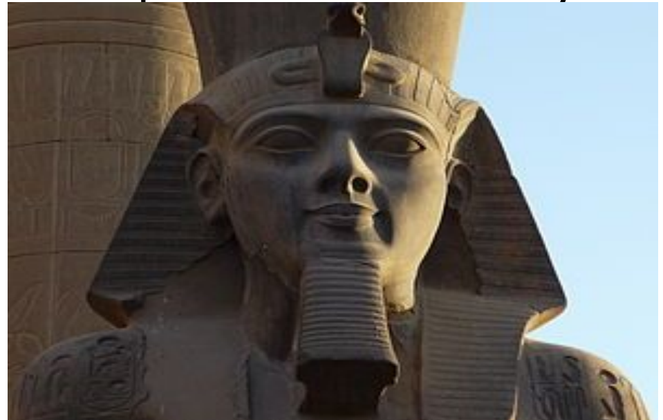
Статуя фараона Рамзеса II.