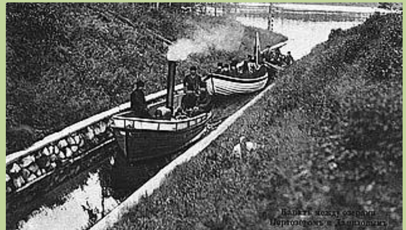
Вахты между озерами Пирозовым и Давидовым