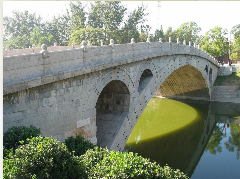
Большой Каменный мост (пров. Хэбэй) — редкий памятник зодчества династии Суй.