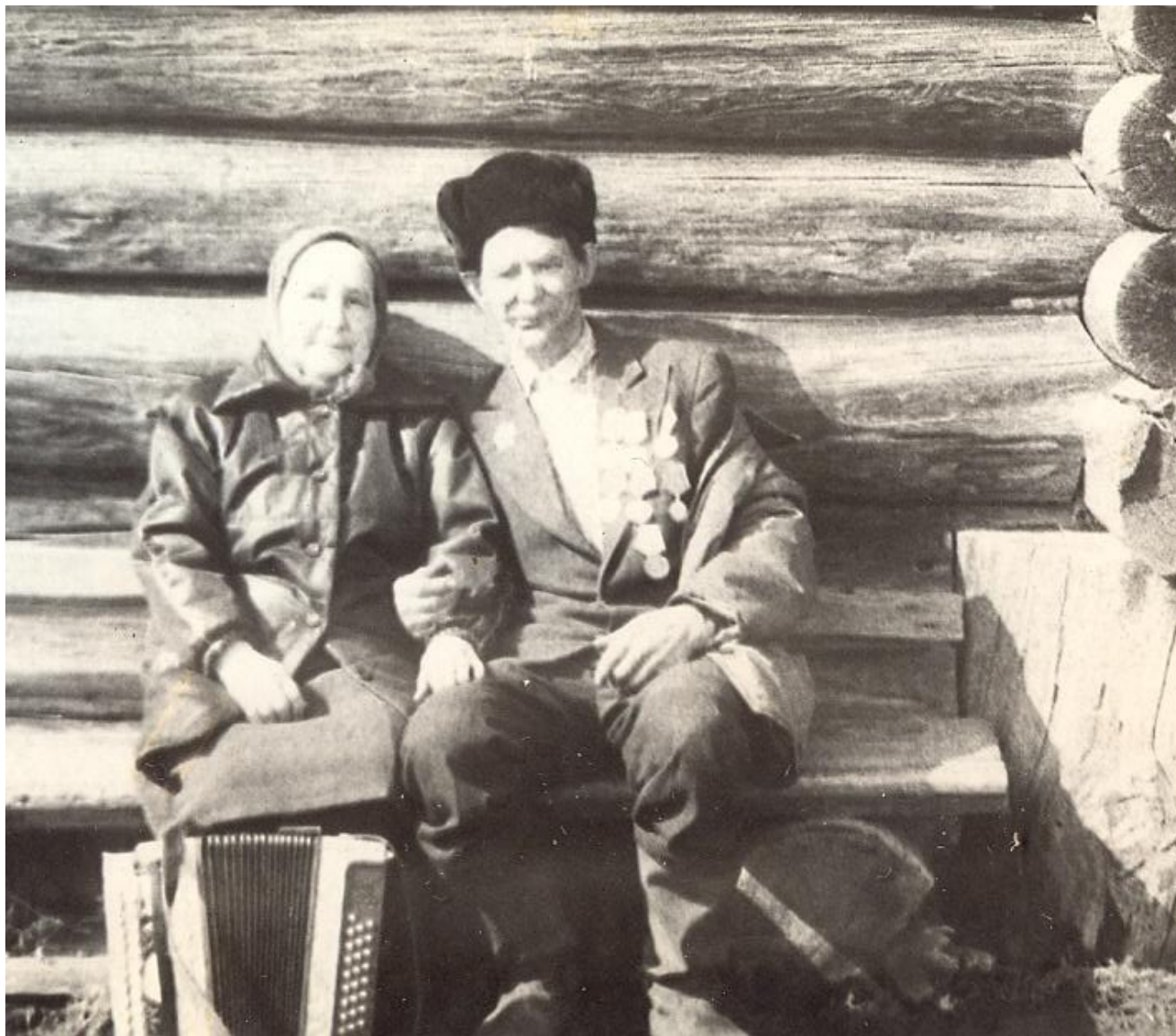
На празднике 9 Мая!