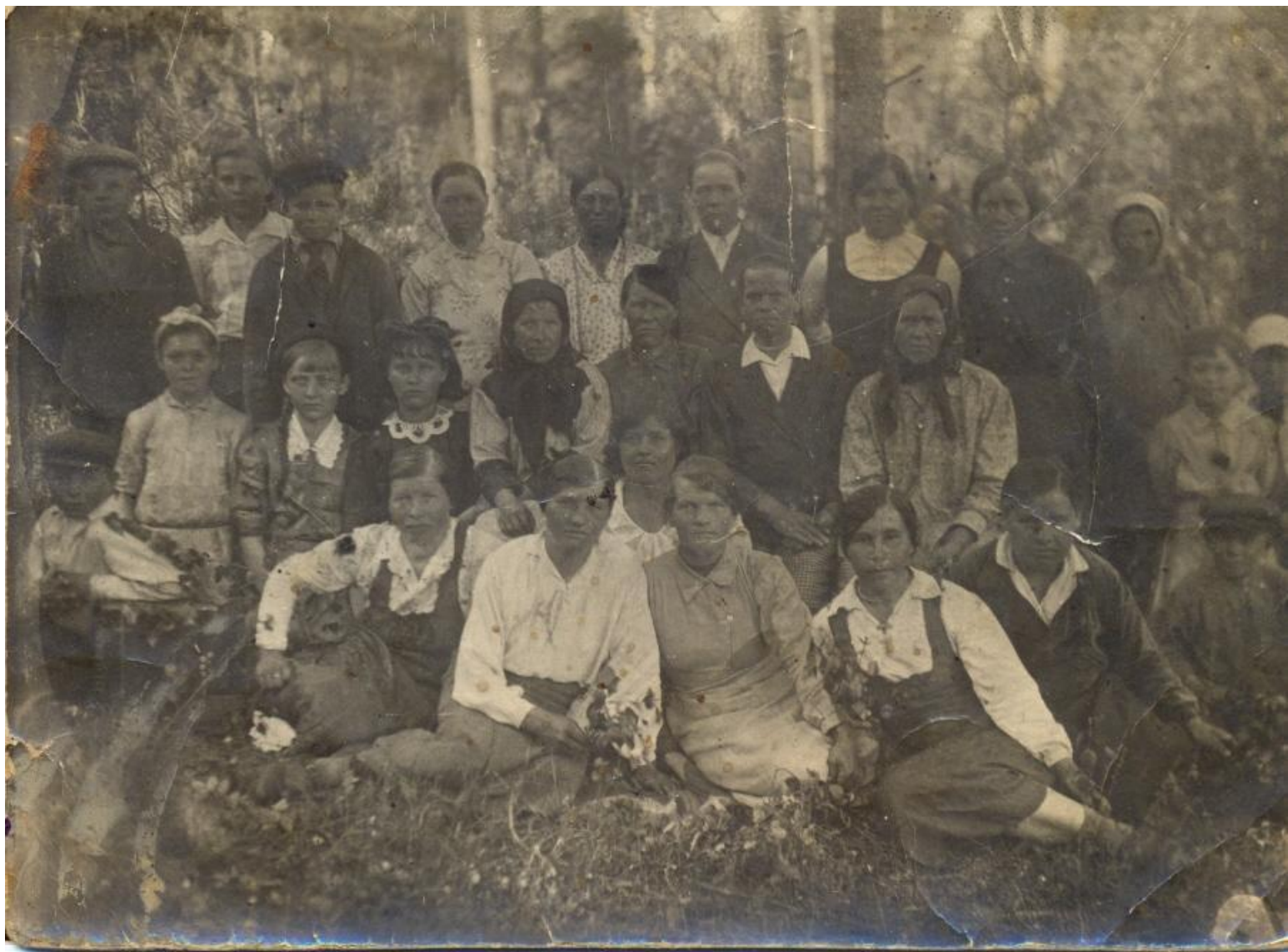
Бригада женщин -