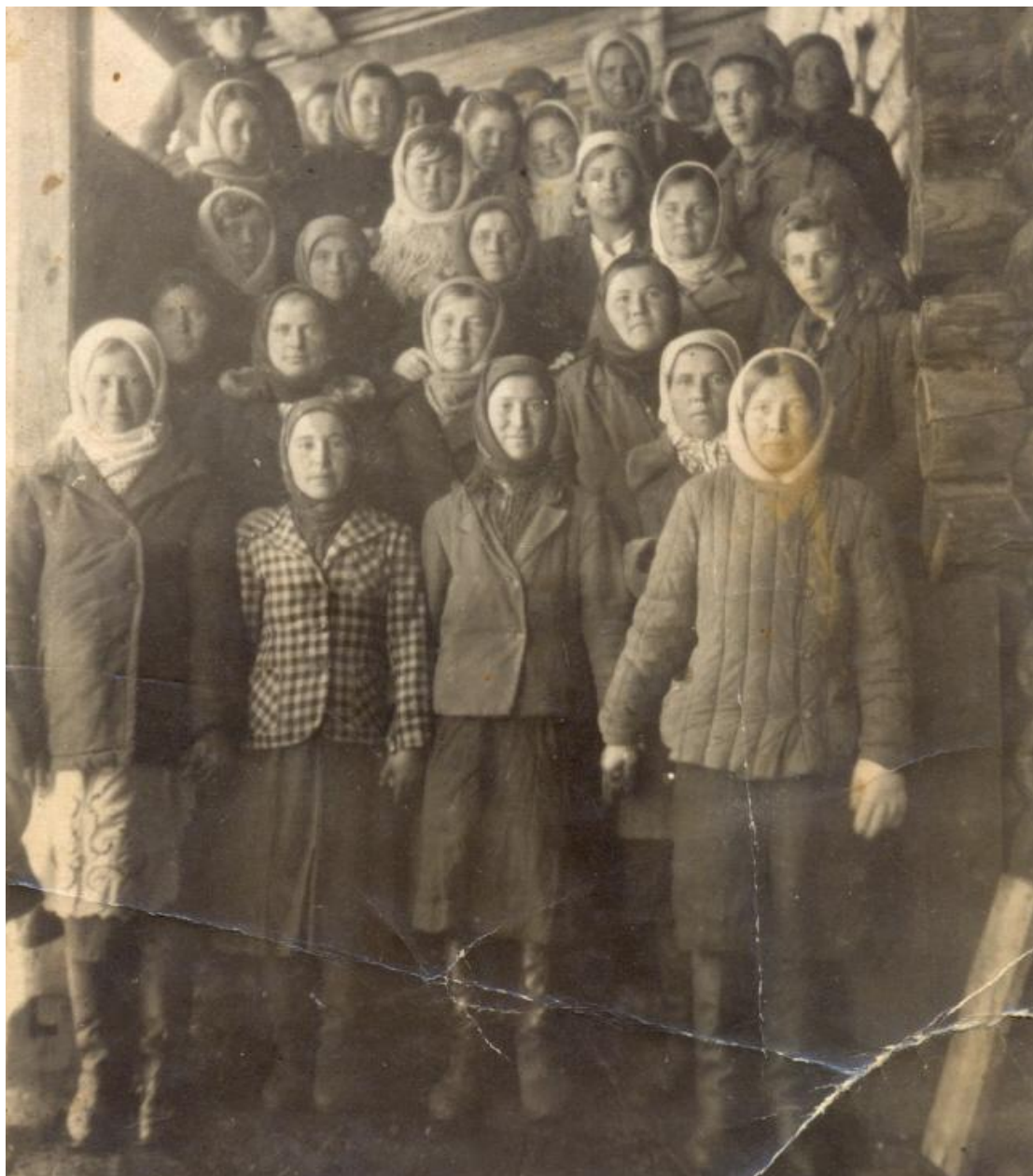
Бригада животноводов д. Бехтерева