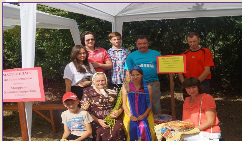
Мастер - класс на празднике «День села», 2014 год