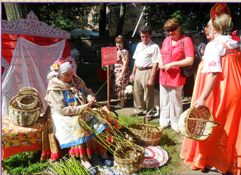
Мастер - класс в районном празднике «День Ардатова»