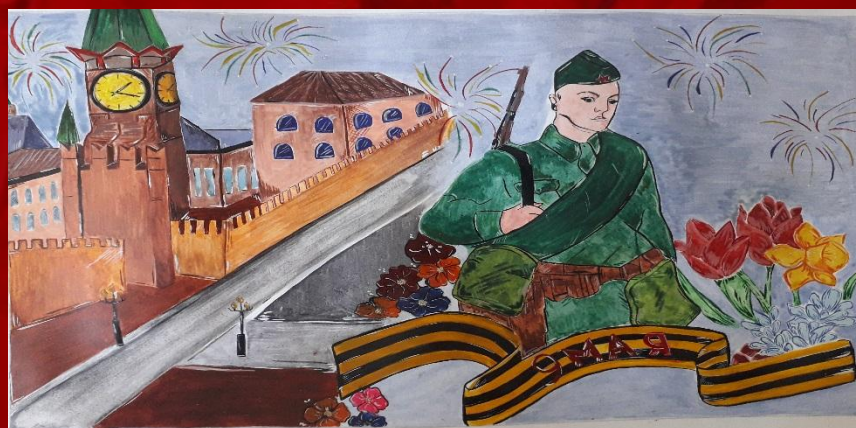
Рисунок Филатовой Юлии, выпускницы 9 класса 2020