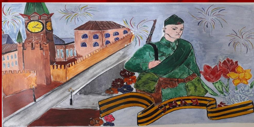
Рисунок Филатовой Юлии, выпускницы 9 класса 2020