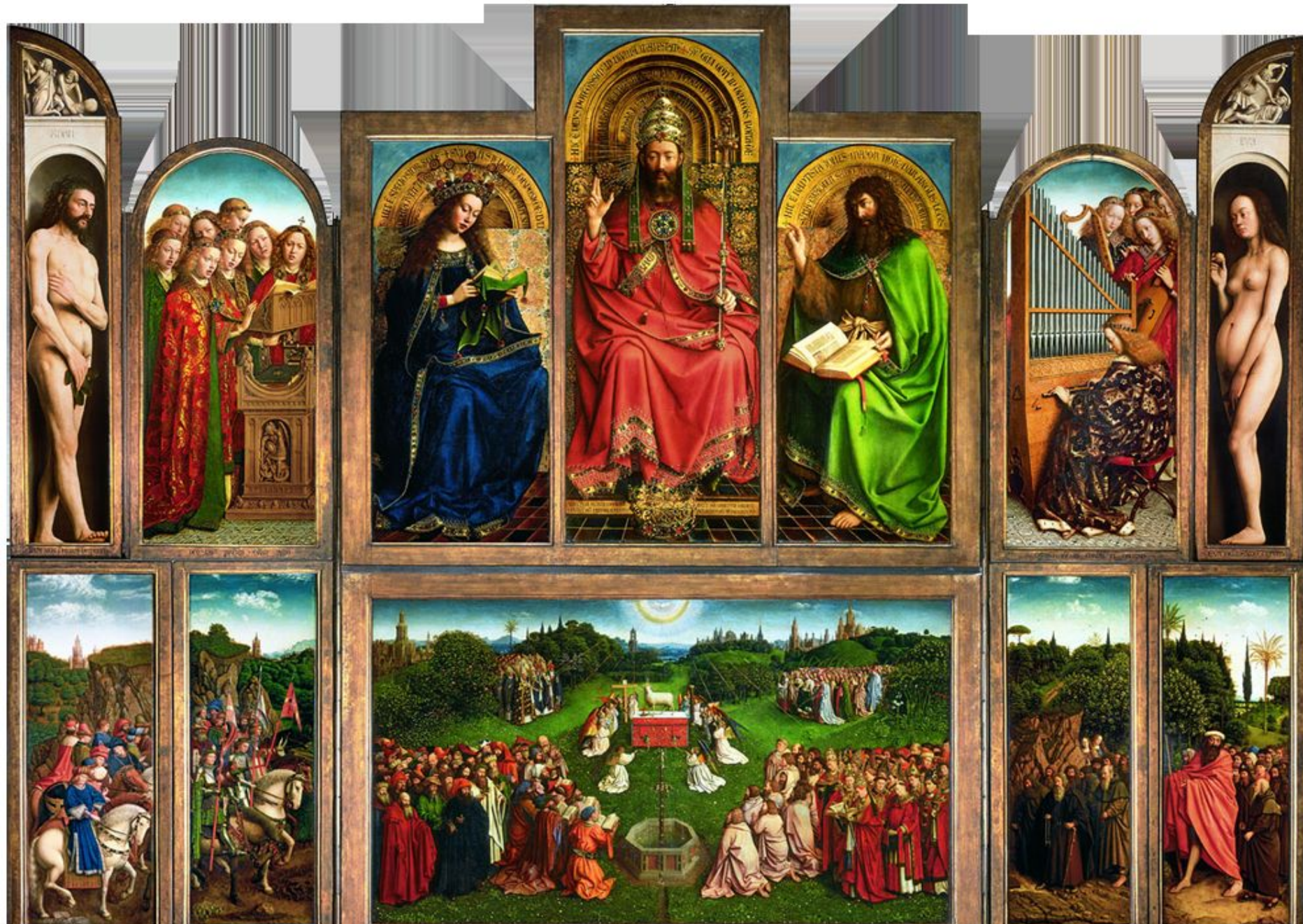
Ян ван Эйк. Гентский алтарь . 1432 г. (Собор Святого Бовона. Гент)