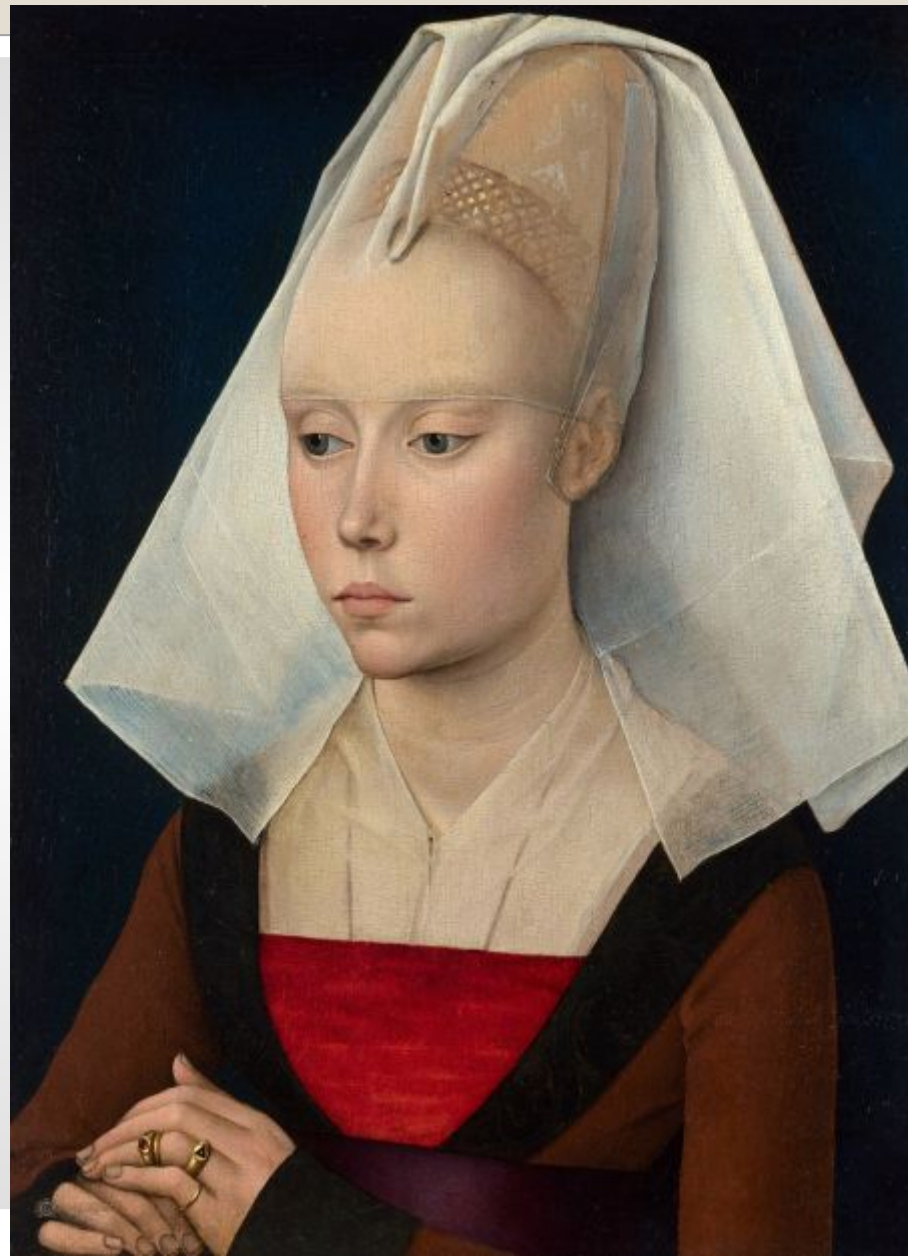
Женский портрет. Рогир ван дер Вейден. 1450 – 1460 гг.

Рогир ван дер Вейден (1399/1400, Турне — 18 июня 1464, Брюссель) — нидерландский живописец, наряду с Яном ван Эйком считается одним из основоположников и наиболее влиятельных мастеров ранненидерландской живописи. Творчество ван дер Вейдена сфокусировано на постижении индивидуальности человеческой личности во всей её глубине.