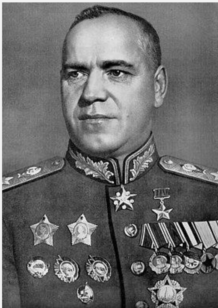
ЖУКОВ ГЕОРГИЙ КОНСТАНТИНОВИЧ