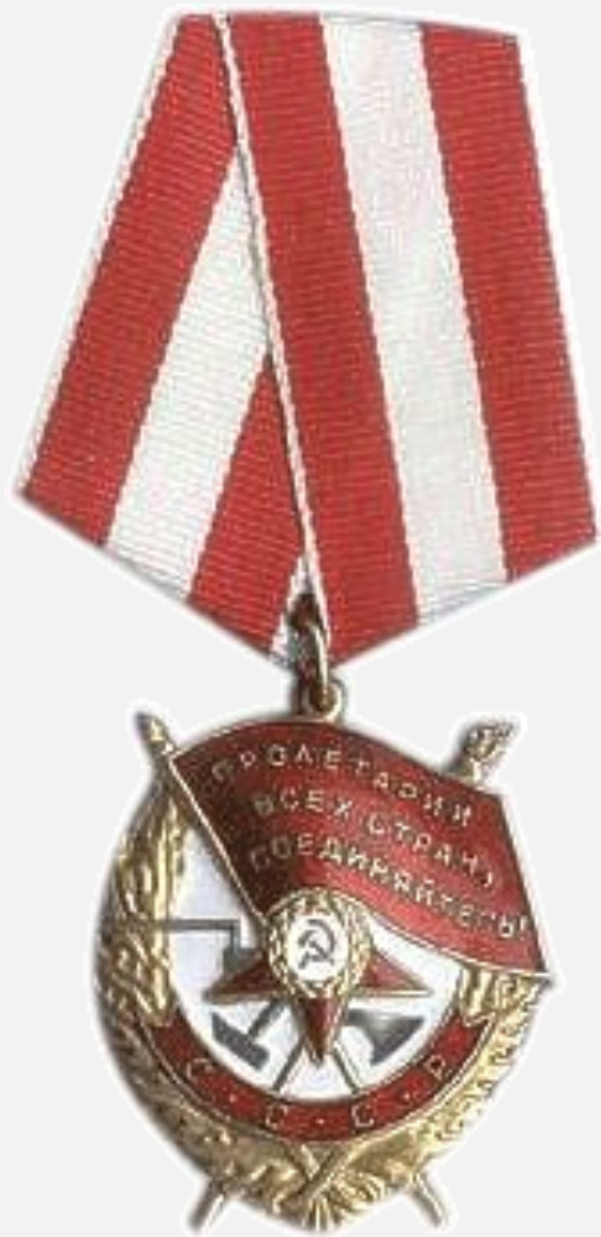
ОРДЕН КРАСНОГО ЗАМЕНИ