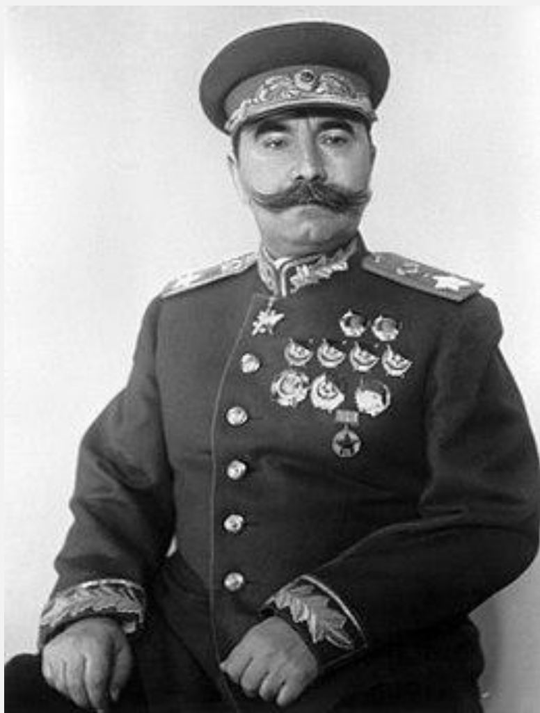
БУДЕННЫЙ СЕМЁН МИХАЙЛОВИЧ