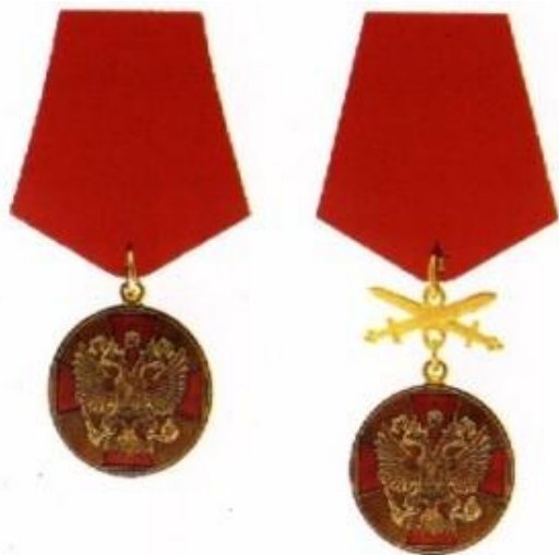
МЕДАЛЬ ОРДЕНА "ЗА ЗАСЛУГИ ПЕРЕД ОТЕЧЕСТВОМ" I СТЕПЕНИ