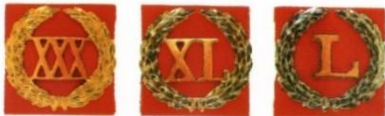
ЗНАК ОТЛИЧИЯ "ЗА БЕЗУПРЕЧНУЮ СЛУЖБУ" (НА ЛЕНТЕ ОРДЕНА "ЗА ЗАСЛУГИ ПЕРЕД ОТЕЧЕСТВОМ")

Знаком отличия "За безупречную службу" награждаются граждане, избранные или назначенные на должности в соответствии с Конституцией Российской Федерации и федеральными законами, а также государственные служащие.