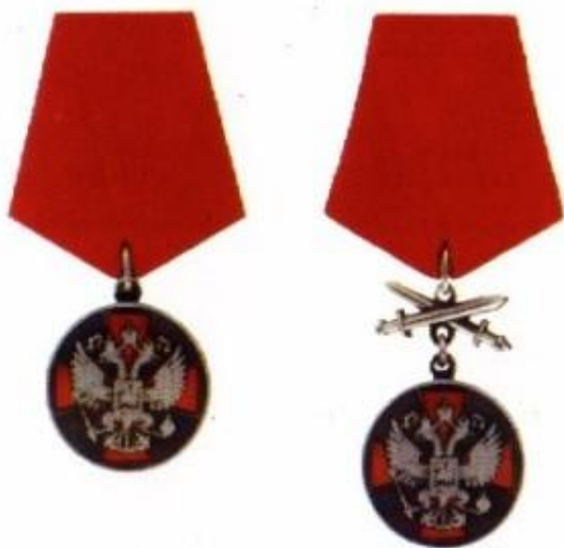
МЕДАЛЬ ОРДЕНА "ЗА ЗАСЛУГИ ПЕРЕД ОТЕЧЕСТВОМ" II СТЕПЕНИ

Медалью ордена "За заслуги перед Отечеством" награждаются граждане за осуществление конкретных и полезных для страны дел в промышленности и сельском хозяйстве, строительстве и на транспорте, в науке и образовании, здравоохранении и культуре, в других областях трудовой деятельности; за большой вклад в дело защиты Отечества, успехи в поддержании высокой боевой готовности подразделений, частей и соединений, за отличные показатели в боевой подготовке и иные заслуги во время прохождения военной службы; за укрепление законности и правопорядка, обеспечение государственной безопасности.