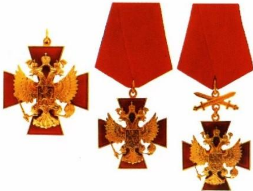
ОРДЕН "ЗА ЗАСЛУГИ ПЕРЕД ОТЕЧЕСТВОМ" III & IV СТЕПЕНИ