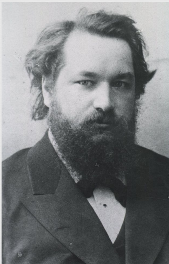
С. С. Корсаков

Реформы в российских психиатрических учреждениях связаны с именем С. С. Корсакова (1854 – 1900), одного из основателей российской научной психиатрии и нозологического направления. В его московской психиатрической клинике были ликвидированы все меры стеснения, упразднены изоляторы, были сняты решетки с окон отделений, введены постельное содержание острых больных и занятия на открытом воздухе для больных с затяжными болезнями.