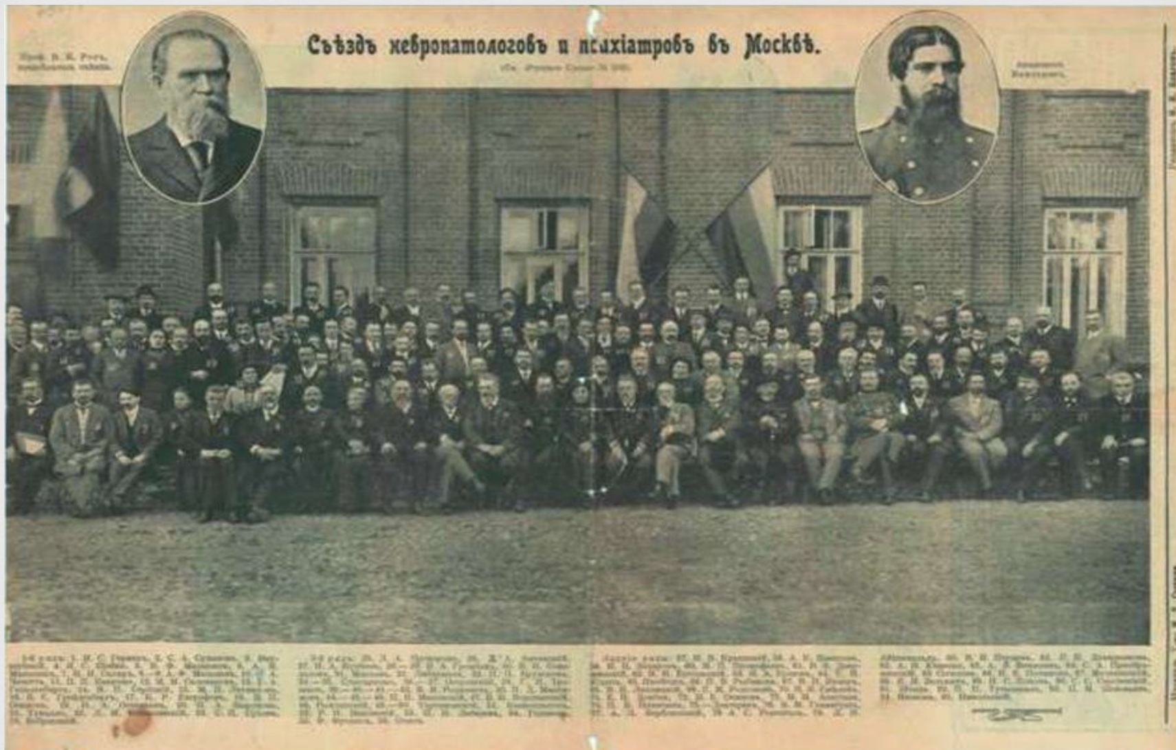
Первый съезд союза психиатров 1911 год