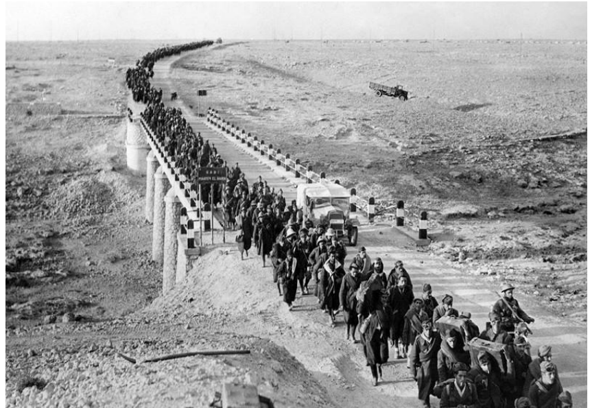
День эвакуации английских военных баз