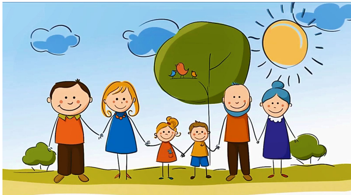
Семья. Там, где живет счастье!

Семейные ценности — это обычаи и традиции, которые передаются из поколения в поколение.