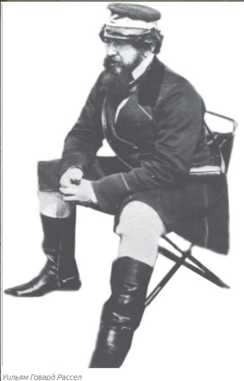
Уильям Говард Рассел

первого военного корреспондента" принадлежит Уильяму Говарду Расселу.