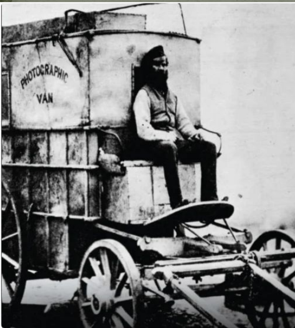
Роджер Фентон и его проявочная лаборатория на колёсах

Параллельно с текстами военных корреспондентов начали публиковаться работы первых военных фотожурналистов. Несмотря на все недостатки находящегося в зачаточном состоянии фото-оборудования, работы Роджера Фентона и Джеймса Робертсона позволили обывателю хотя бы одним глазком взглянуть на то, как выглядит война.