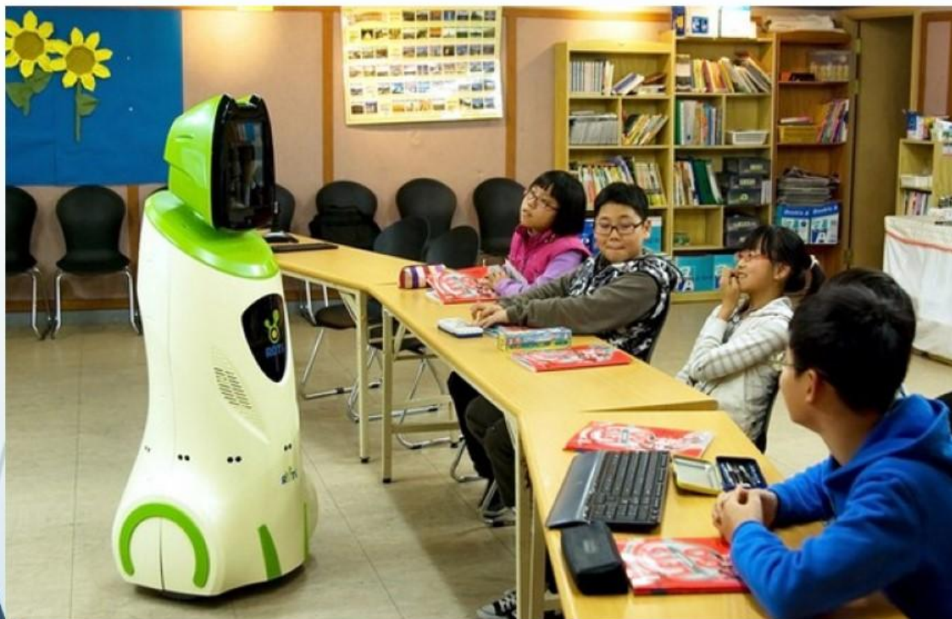
Робот виконує роль учителя-тренера