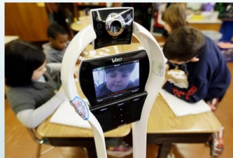
Електронний представник хворої дитини