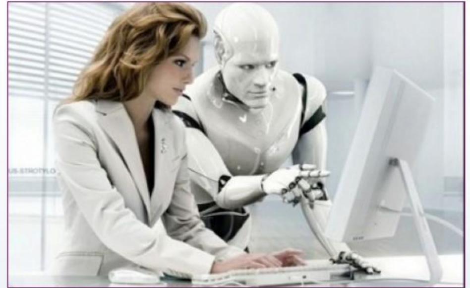
Підготовка до уроку

У суспільстві відбувається революція в способі отримання знань. Завдяки розвитку інформаційних технологій знання знаходяться всюди, треба лише знати спосіб їх отримання. У зв'язку з цим, вчитель втратив монополію на знання в основному одного предмета. Виходить, що вчитель тепер не потрібний, а його роль знецінилась?