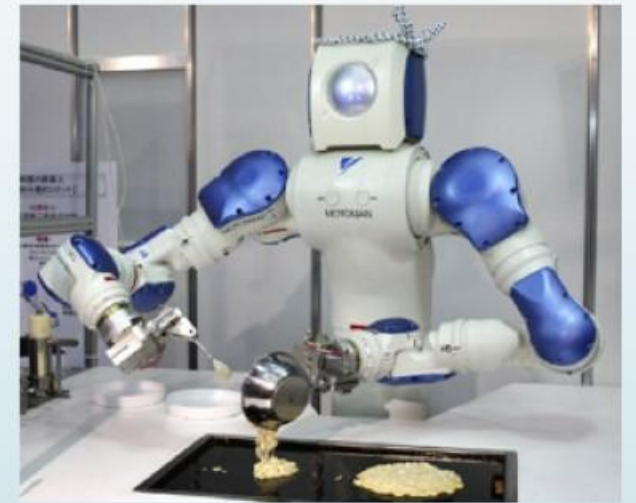
Аудиторія технології приготування їжі