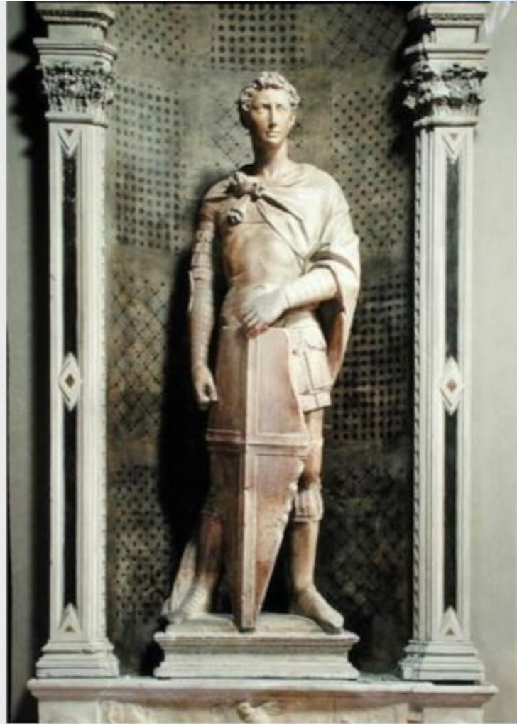
Донателло (Донато ди Никколо ди Бетто Барди, 1386-1466). Св. Георгий. Статуя для церкви Ор Сан Микеле во Флоренции. 1415-1417. Флоренция, Национальный музей.