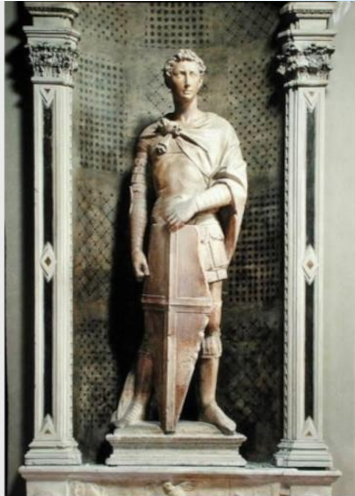
Донателло (Донато ди Никколо ди Бетто Барди, 1386-1466). Св. Георгий. Статуя для церкви Ор Сан Микеле во Флоренции. 1415-1417. Флоренция, Национальный музей.