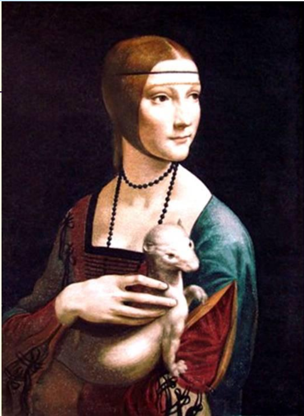
Дама с горностаем