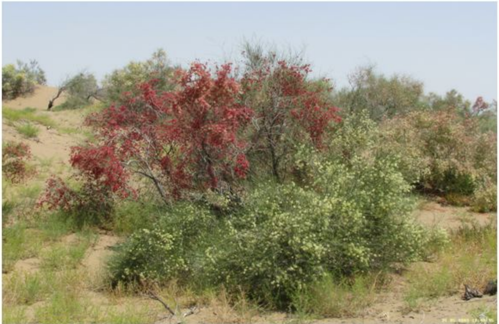
33-nji surat. Garagumyň ösümlük dünýäsi.