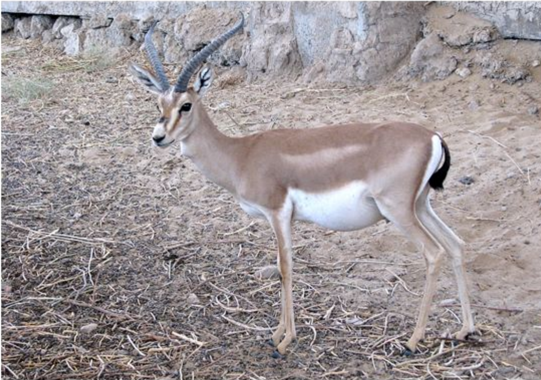
34-nji surat. Jeren – seýrek duş gelyän we goralýan haýwan.