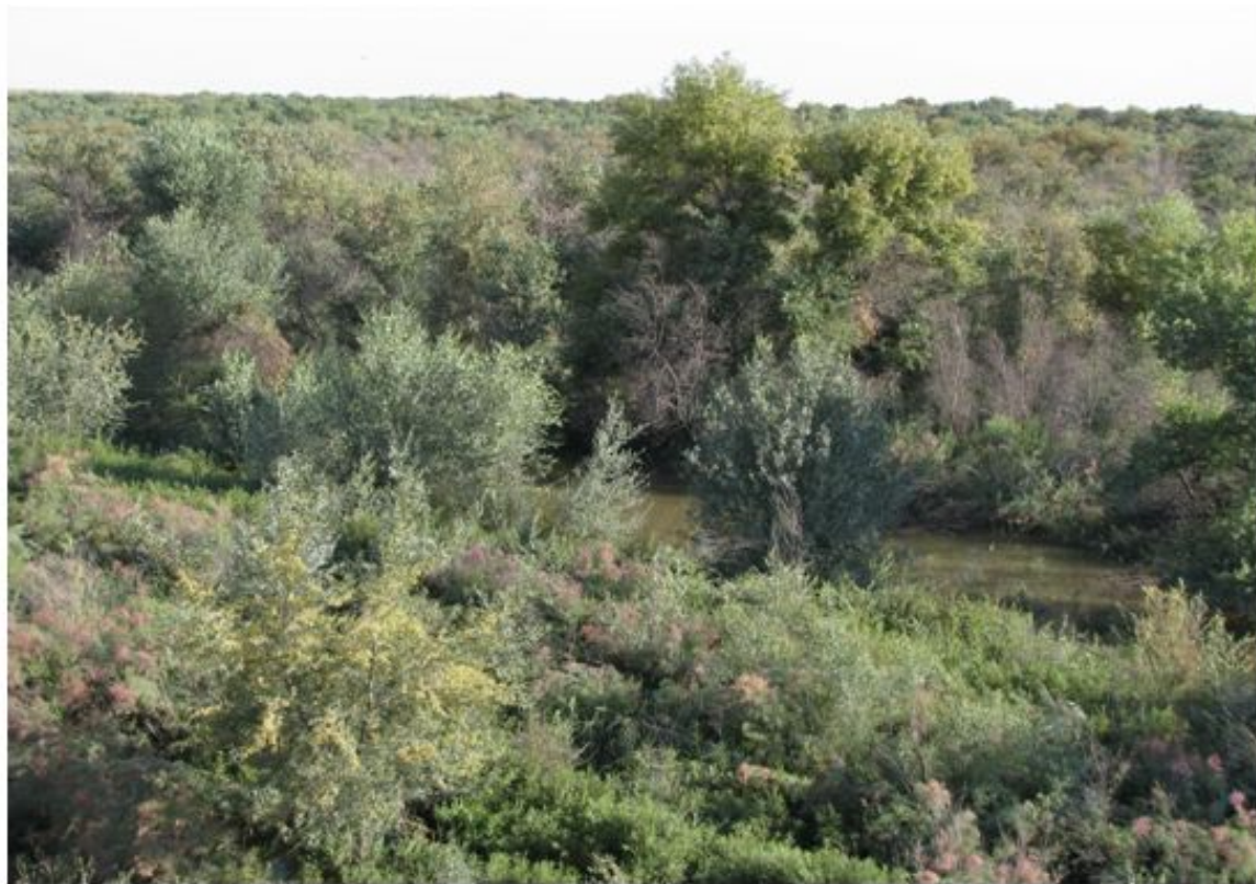
35-nji surat. Amyderýanyň jülgesinde ösýän tokaýlar.

Beýleki köp sanly tebigy baýlyklar bilen deňeşdirilende, seýrek tokaýlar öwezi dolunýan tebigy baýlyklara degişlidir, ýöne topragyň çyglylygynyň güýçli ýetmezçilik edýän şertlerinde bu hadysa uzak wagtyň dowamynda bolup geçýär. Türkmenistanda derýa jülgelerinde, çaylymlarda jeňňellikler ýaýrandyr. Bu ýerde tokaý agaçlarynyň düzümi dürli bolup, mysal üçin toraňňy, ýylgyn, igde, söwüt ýaly ösümlükler tokaýlygy emele getirýär (35-nji surat).