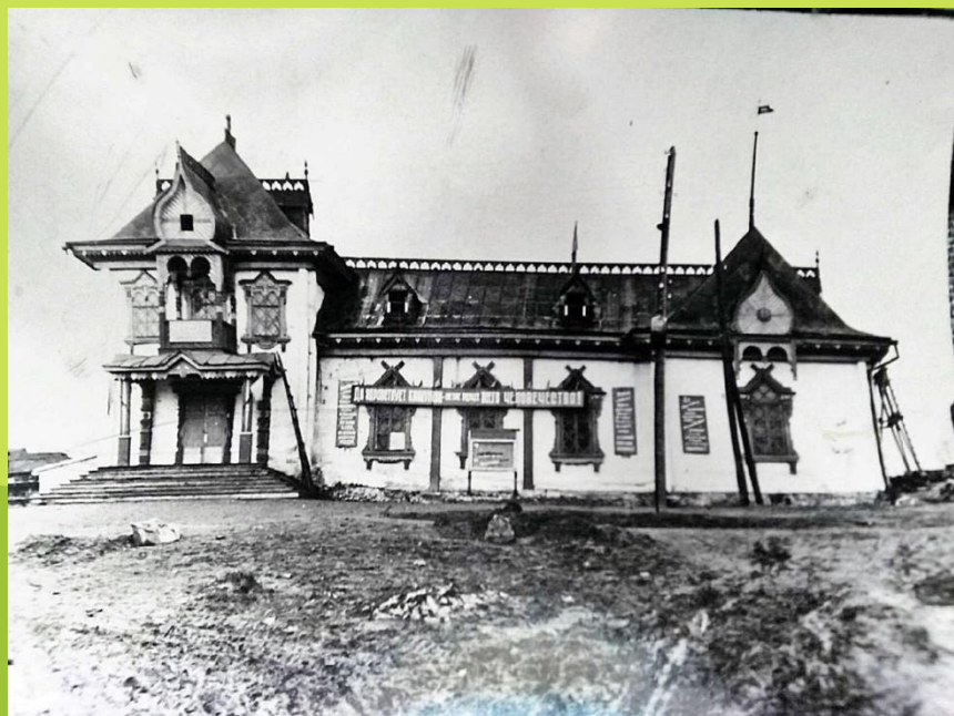
Народный дом 1917г.