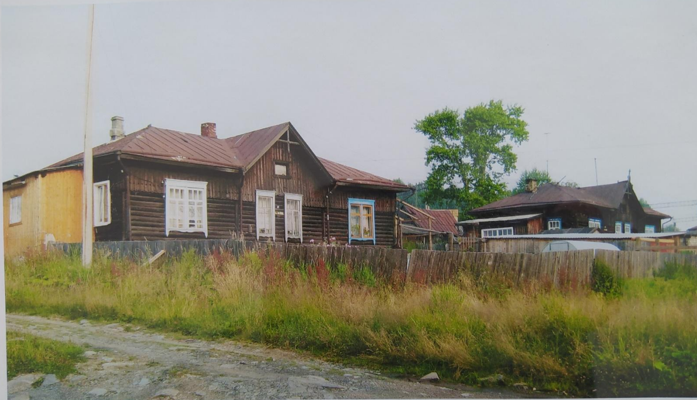
Дома, построенные пленными австрийцами в 1915 г.