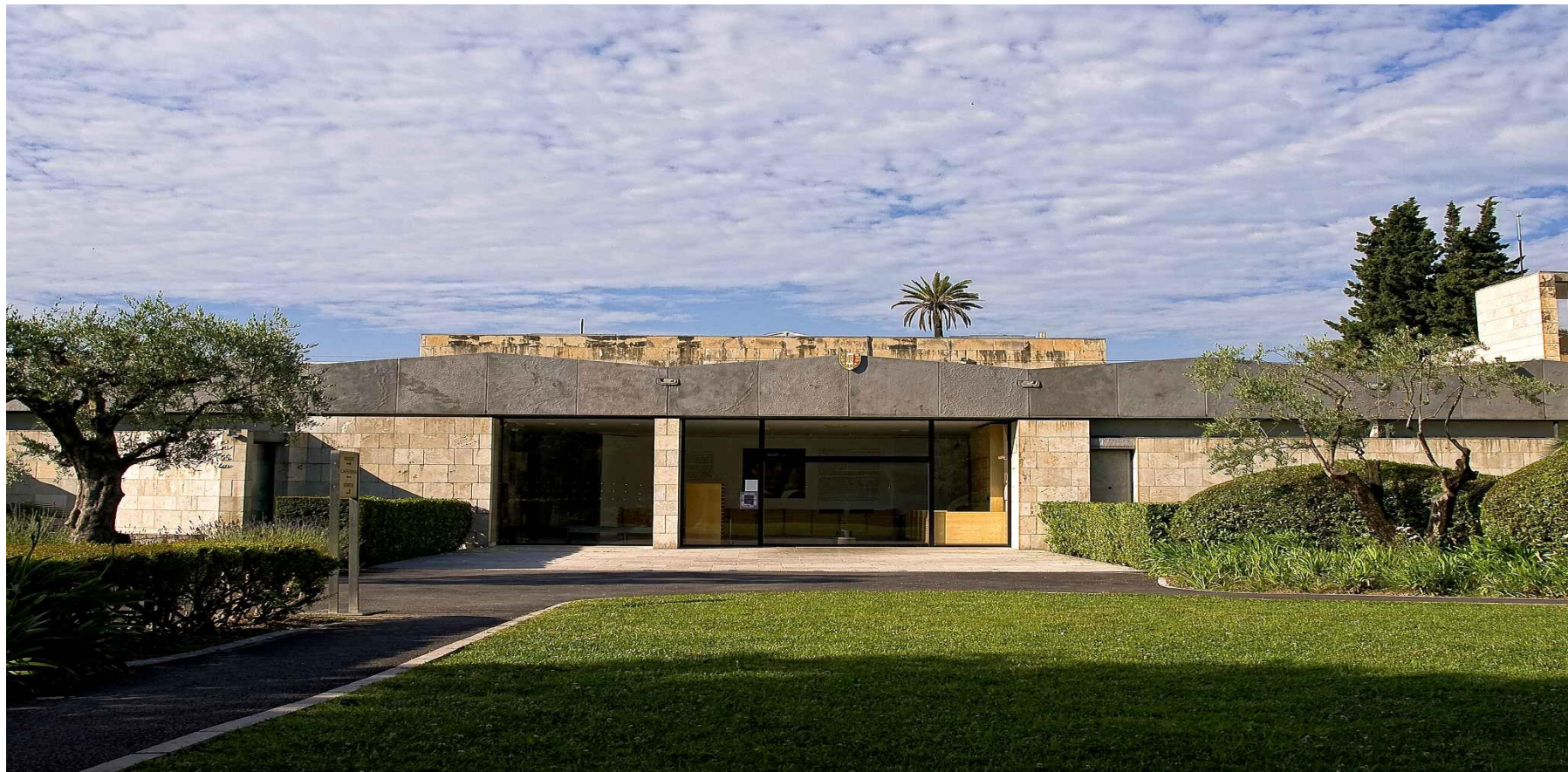
Musée Marc Chagall