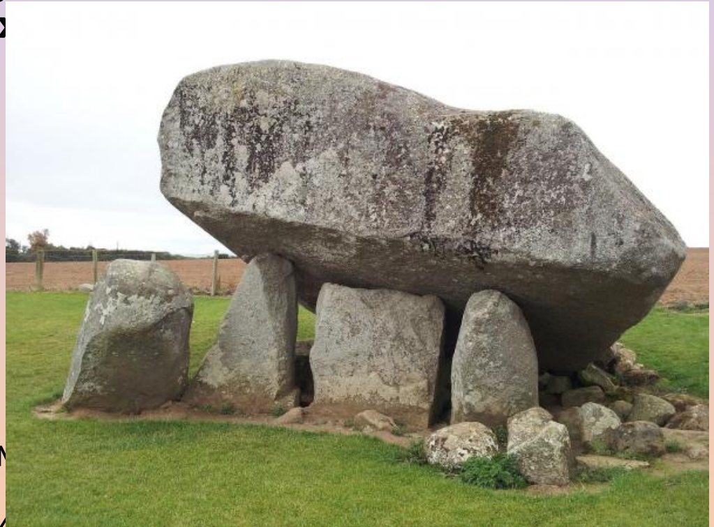
Сейды в Ирландии

Аналогичные объекты встречаются в Британии, Ирландии и Исландии. В Исландии Исландские Рунические Камни считаются домами эльфов. Возможно, самым знаменитым магическим каменным сооружением является Стоунхендж в Англии.