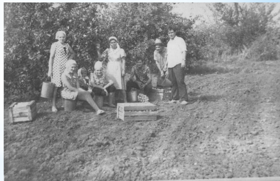
Сбор урожая в плодосовхозе «Восточный» (фото пригл. 1971 г.)