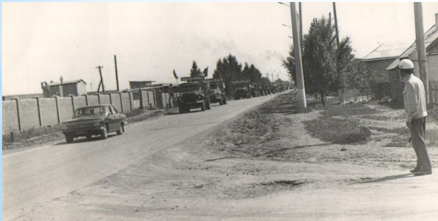
По улицам п. Орловского идет колонна автомобилей с первым урожаем 1973г.