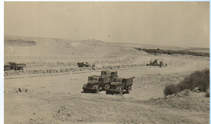
Строительство асфальтированной трассы п. Орловский – х. Курганный.