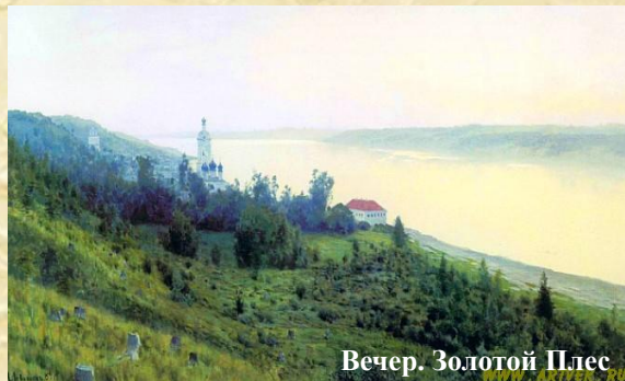
Вечер. Золотой Плес