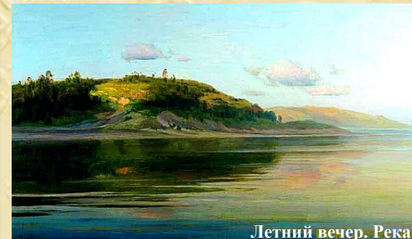
Летний вечер. Река