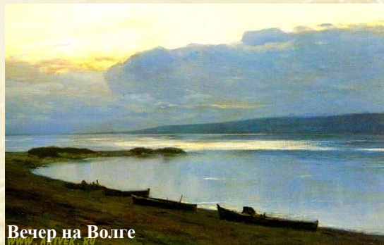
Вечер на Волге

6. Настоящий художник Левитан сумел подарить людям счастливые мгновения своей жизни.