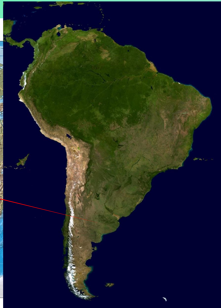
Физическая карта Мира