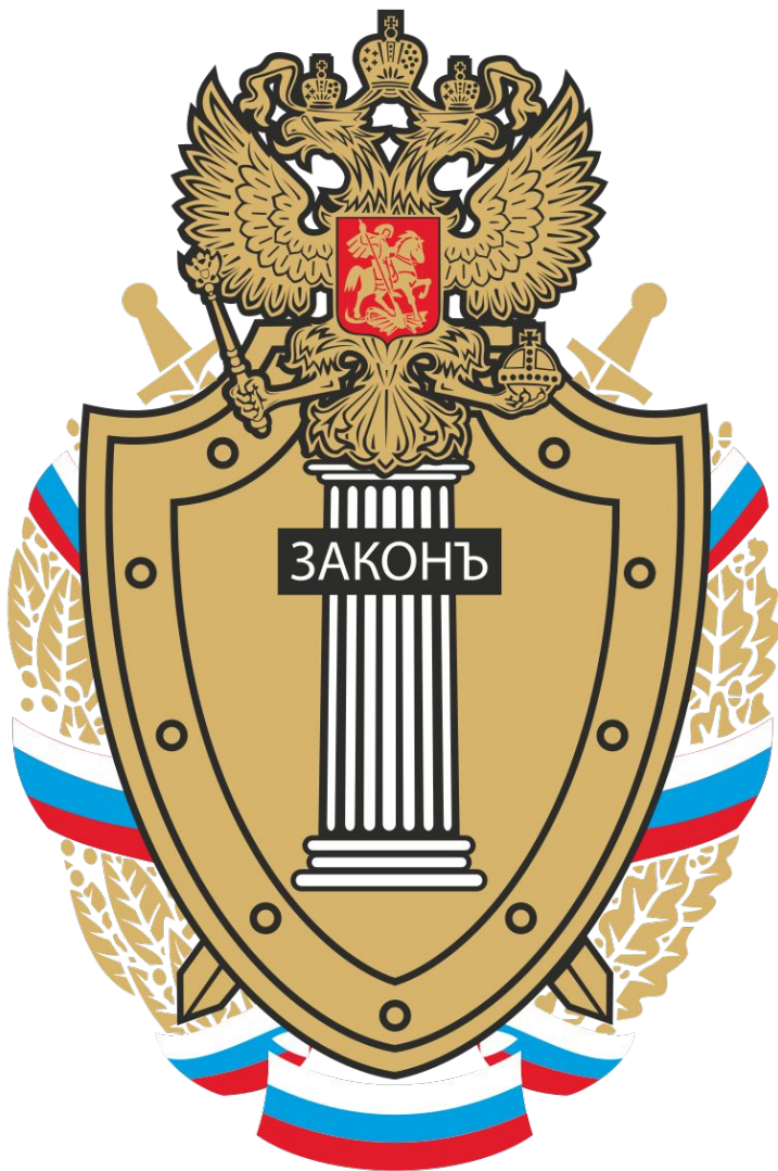
Эмблема военной прокуратуры Российской Федерации