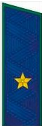
Государственный советник юстиции 3 класса