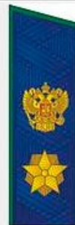
Действительный государственный советник юстиции