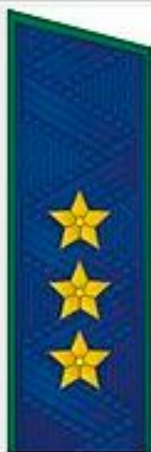
Государственный советник юстиции 1 класса