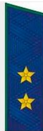
Государственный советник юстиции 2 класса