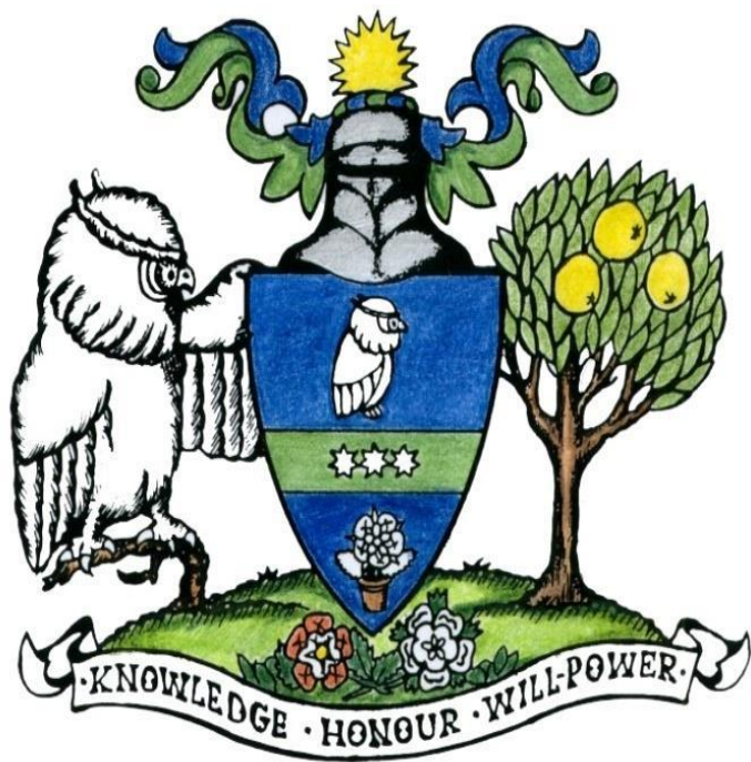
Герб школы №21

Эмблема, очень похожа на герб, когда художественными средствами и специальными знаками раскрывается идея.