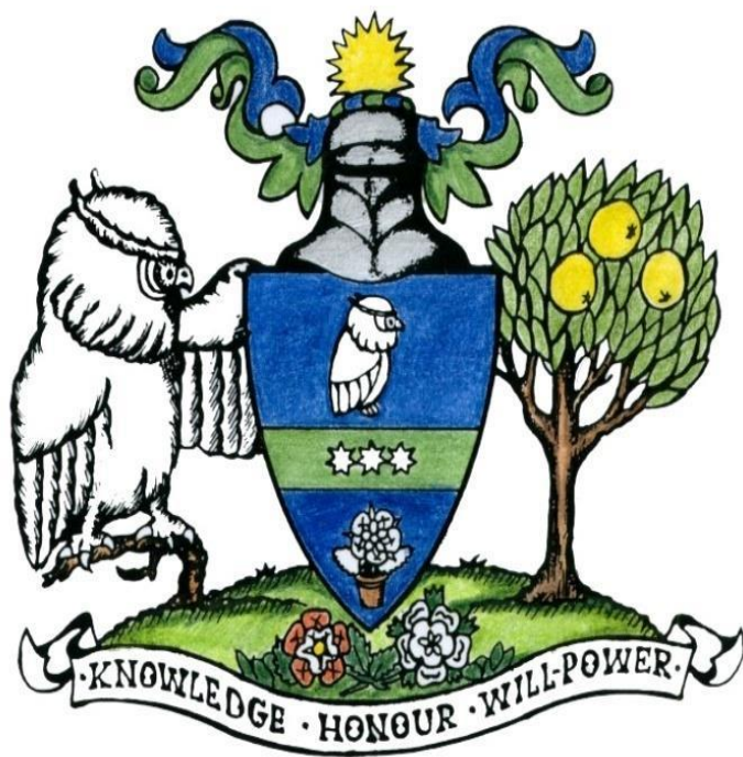
Герб школы №21

Эмблема, очень похожа на герб, когда художественными средствами и специальными знаками раскрывается идея.