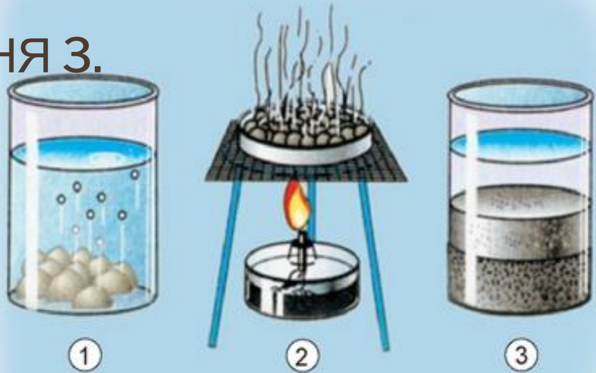
Мал. 102. Визначення складу ґрунту