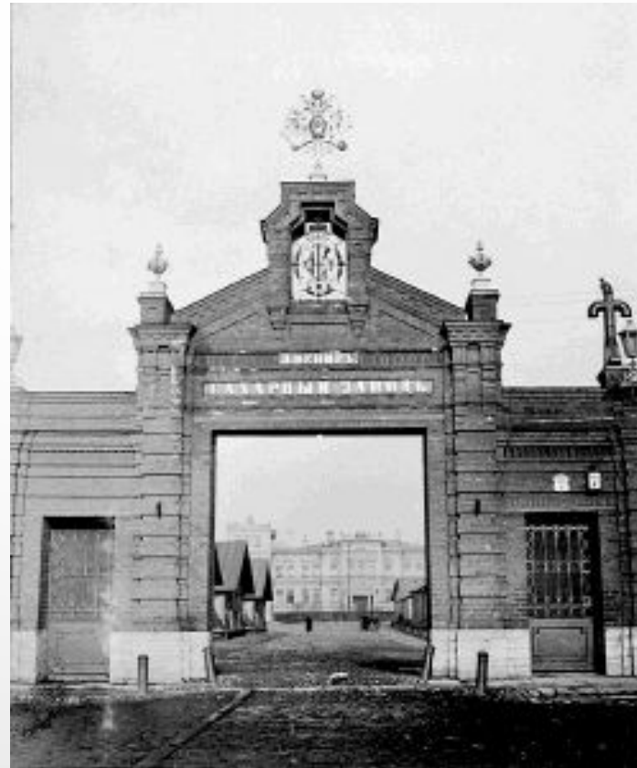
Фабричные ворота сахарного завода Кёнига в Санкт-Петербурге