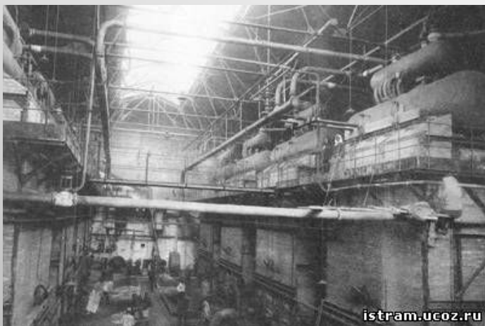
Паровичная в заводском корпусе. Рамонский сахарный завод в сезон 1913 года.