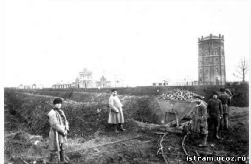
Кагатирование и транспортировка сахарной свеклы. Фото 1900 года