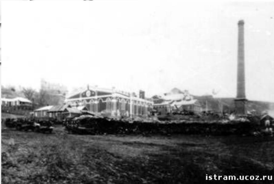
Сахарный завод в Рамони (Воронежская обл.)