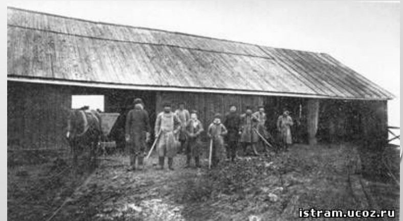
Наумкин хутор (пос. Красное): склад семенной свеклы. Фото начало XX века.