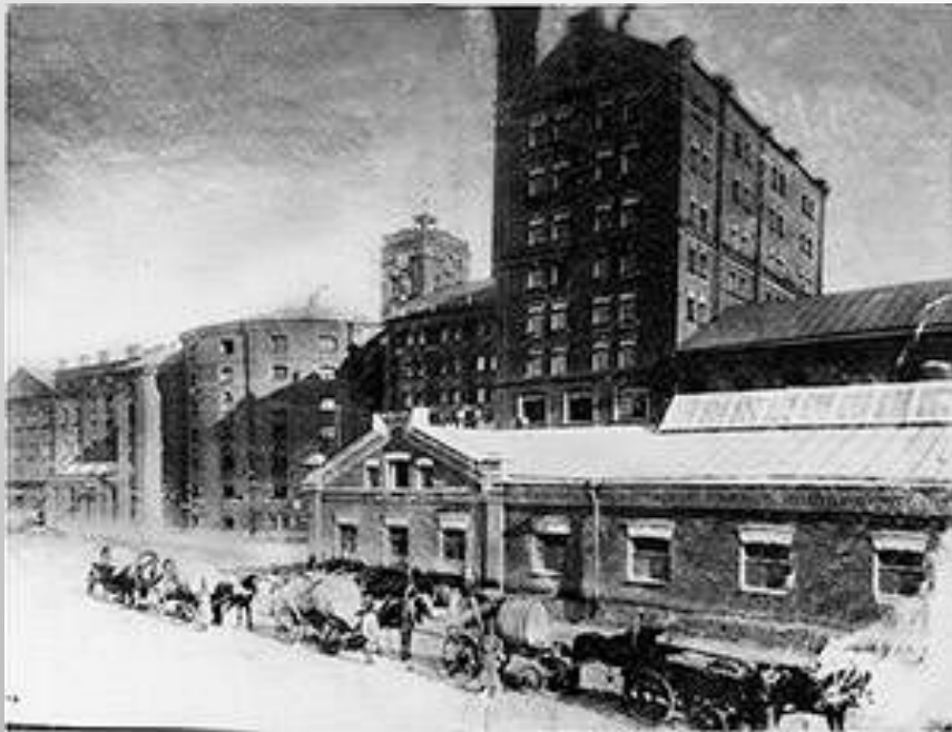
Сахарный завод Кёнига