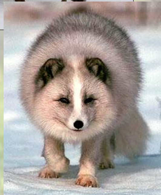
Серебристо – черная лисица