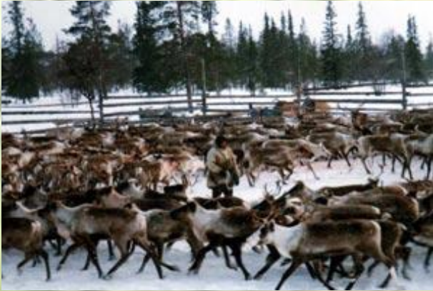
Традиционное занятия народов Якутии (оленоводство)