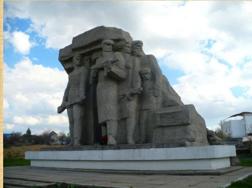
Памятник «Народные мстители»

В память о тех героических событиях вдоль линии главного оборонного рубежа был создан «Пояс Славы» из 11 монументов в различных населенных пунктах, в которых происходили самые ожесточенные бои.