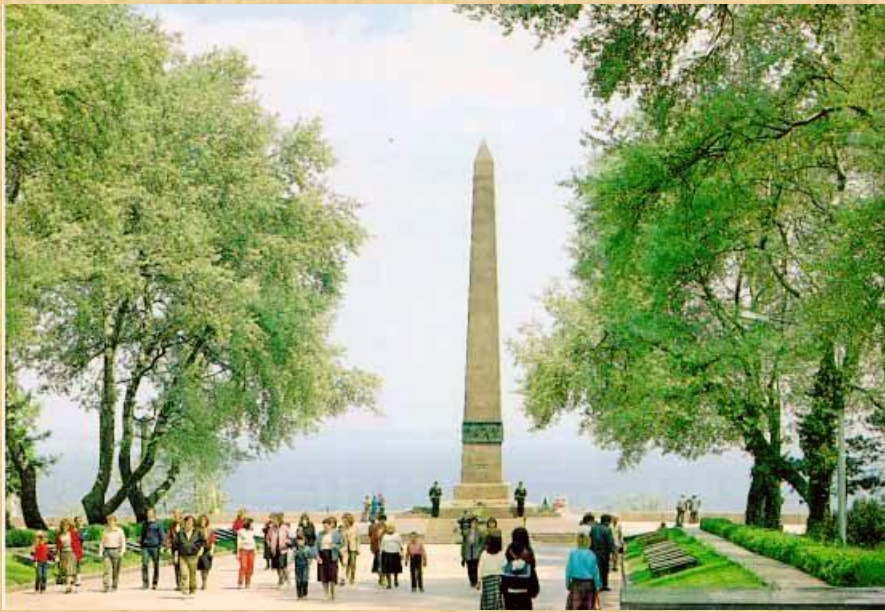
Памятник Неизвестному Матросу и Вечный огонь на Аллее Славы