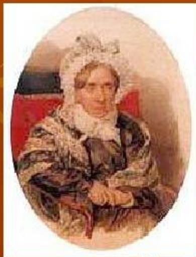
Наталья Кирилловна Загряжская (1747- 1837)

Первая любовь великого поэта, Екатерина Павловна Бакунина, была сестрой лицейского одноклассника и ровесника Пушкина, Александра Бакунина. Чувство к Бакуниной вдохновляло юного поэта. Установлено, что она присутствует в 22 стихотворениях и элегиях А.С.Пушкина. О своей первой любви поэт вспоминал в черновых набросках к "Евгению Онегину". Выйдя замуж в 1834 г. за петербургского друга Пушкина, сына рассказовского помещика А.А.Полторацкого, Бакунина прожила с ним в Тамбовской губернии, в Рассказове, с 1837 г. по 1859 г.