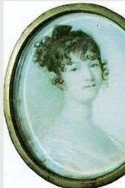
Надежда Осиповна Пушкина