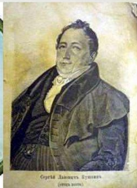
Сергей Львович Пушкина