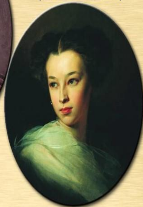
Младшая дочь, Наталья Александровна Пушкина (1836-1913г.)

У А.С.Пушкина и Натальи Гончаровой было четверо детей.