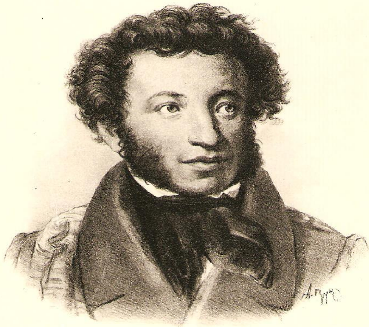
Александр Сергеевич ПУШКИН 1799—1837