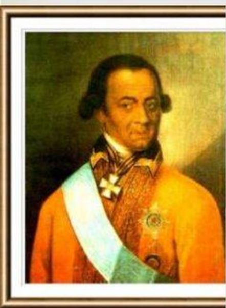
Абрам Петрович Ганнибал