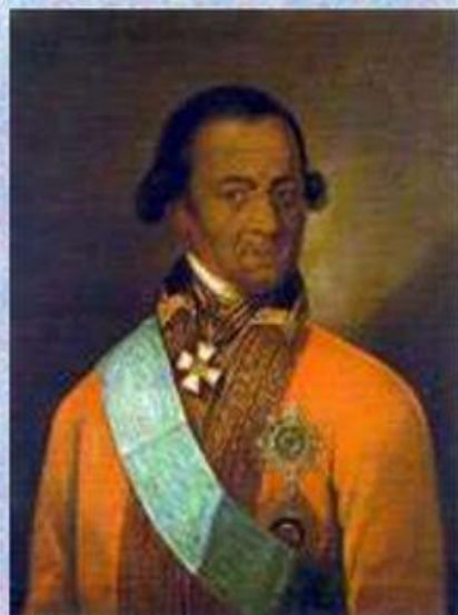
Прадедушка, Абрам Петрович Ганнибал