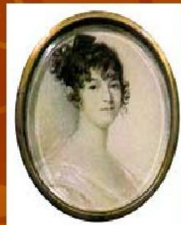
Надежда Осиповна Пушкина мать поэта (1775-1836)