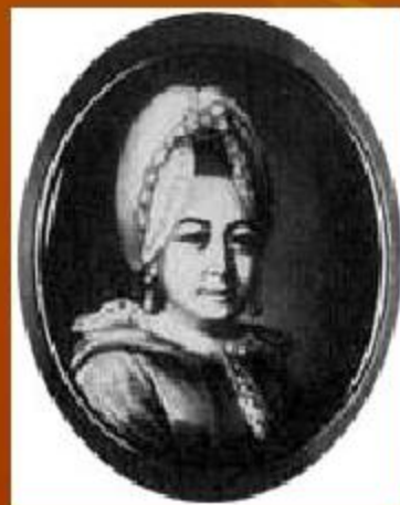
Мария Алексеевна Ганнибал бабушка поэта (1745-1818)