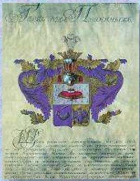
Герб рода Пушкиных