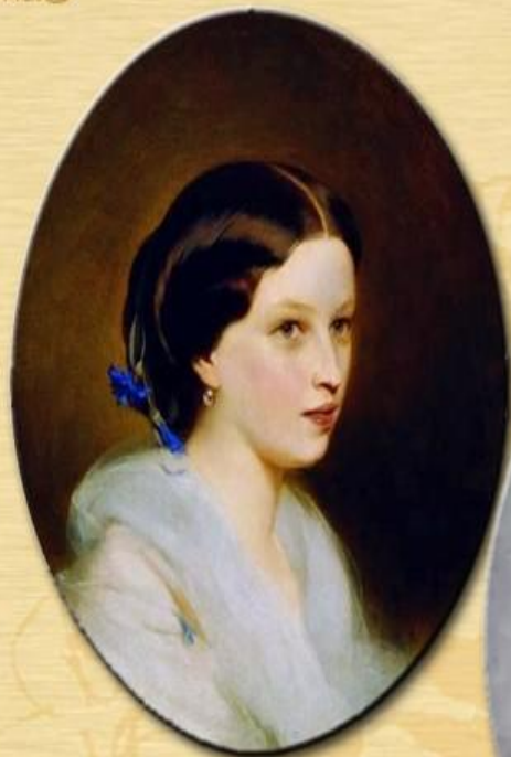
Старшая дочь, Мария Александровна Пушкина (1832-1919г.)