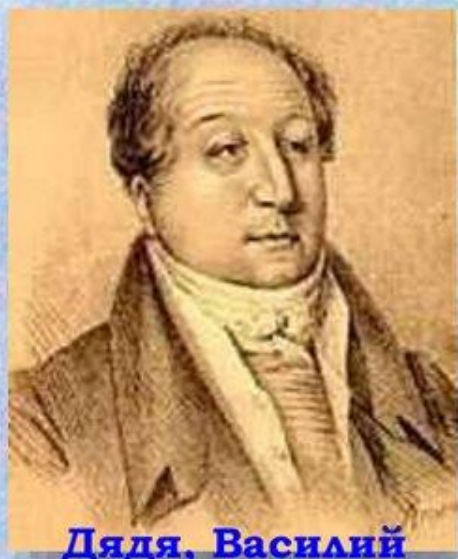
Дядя, Василий Львович Пушкин