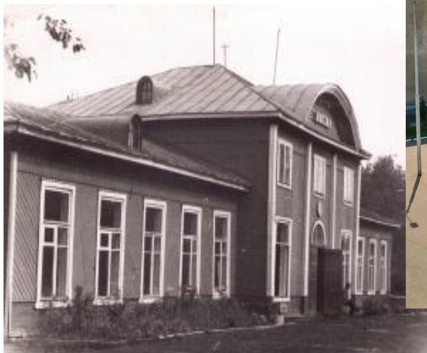
Вокзал станции Янаул