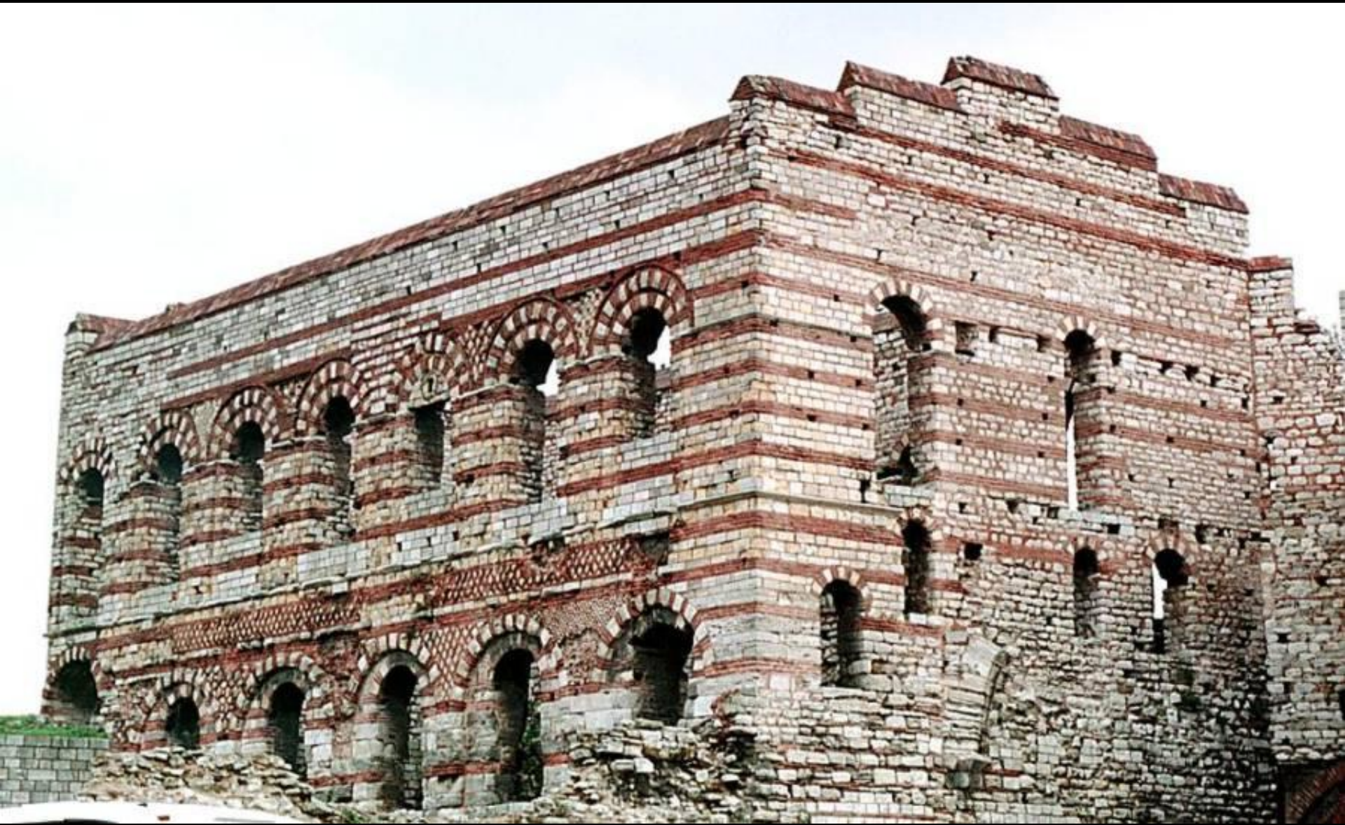
Императорский дворец в Константинополе, Текфур Серай, ранний XIV век.