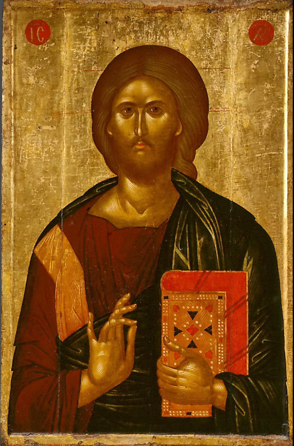
Христос Пантократор, нач. XV века, ГМИИ им. А.С. Пушкина.