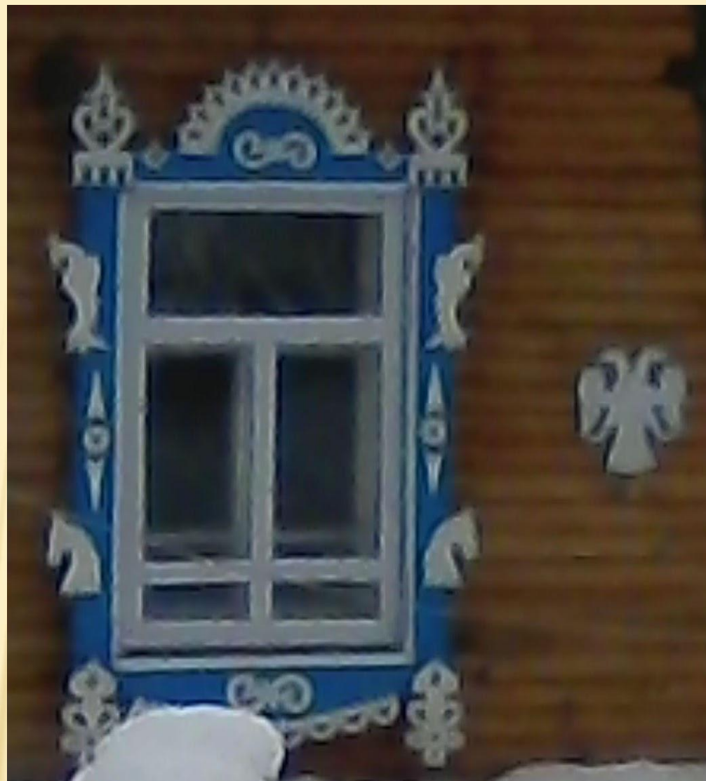
Примеры украшения наличников в нашем селе