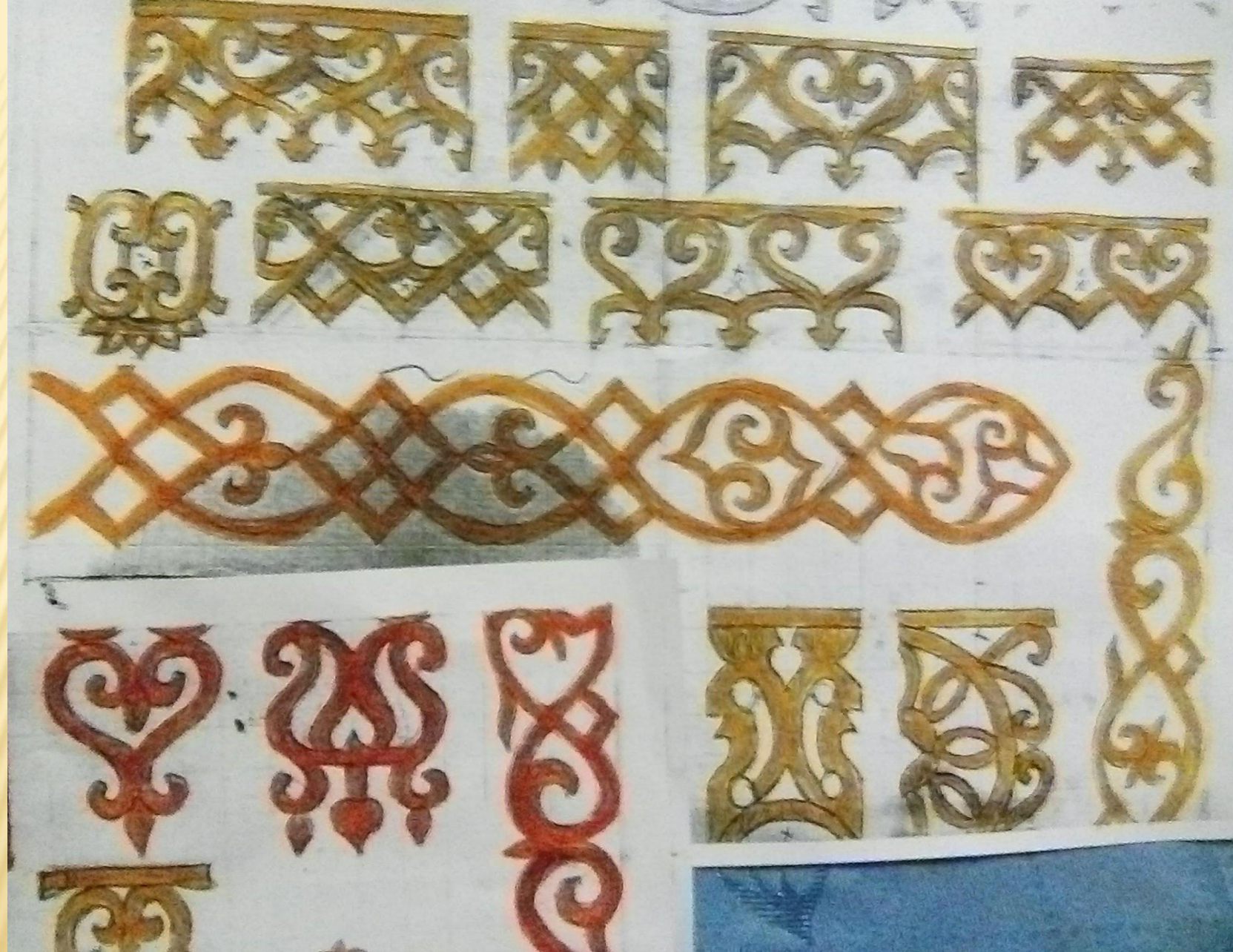
Узоры мастеров- сицкарей