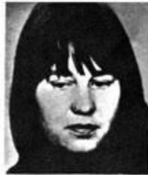
Meinhof, Ulrike, gesch. Rößl, 7. 10. 34 Oldenburg Hafthefehl