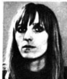
Ensslin, Gudrun, 15. 8. 40 Bartholomae Hafthefehl