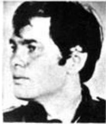
Baader, Andreas Bernd, 6. 5. 43 München Hafthefehl

Первое поколение RAF: У. Майнхоф, А. Баадер, Х. Малер, Г. Энслин; книга «Концепция ведения городской партизанской войны» (Das Konzept Stadtguerilla, 1971), нападение на банки, подготовка в лагере ФАТХ, взрыв на американских базах во Франкфурте (1972), в издательстве Axel Springer и др. Арест