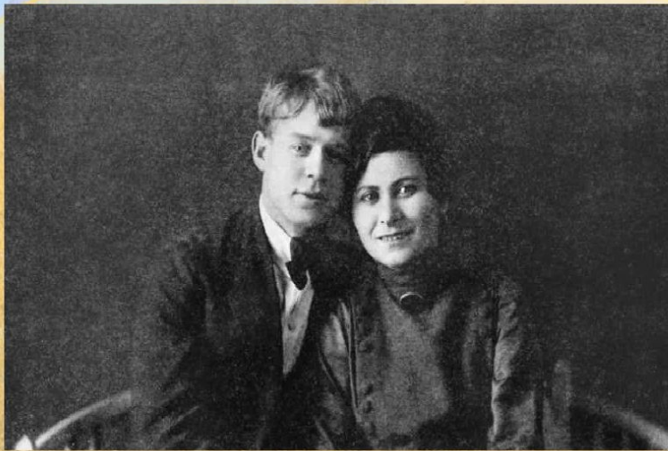
Сергей Есенин и Софья Толстая

Затем в биографии Сергея Есенина произошел побег в Ленинград. А 28 декабря 1925 года наступила смерть Есенина, его тело нашли повешенным в гостинице «Англетер».