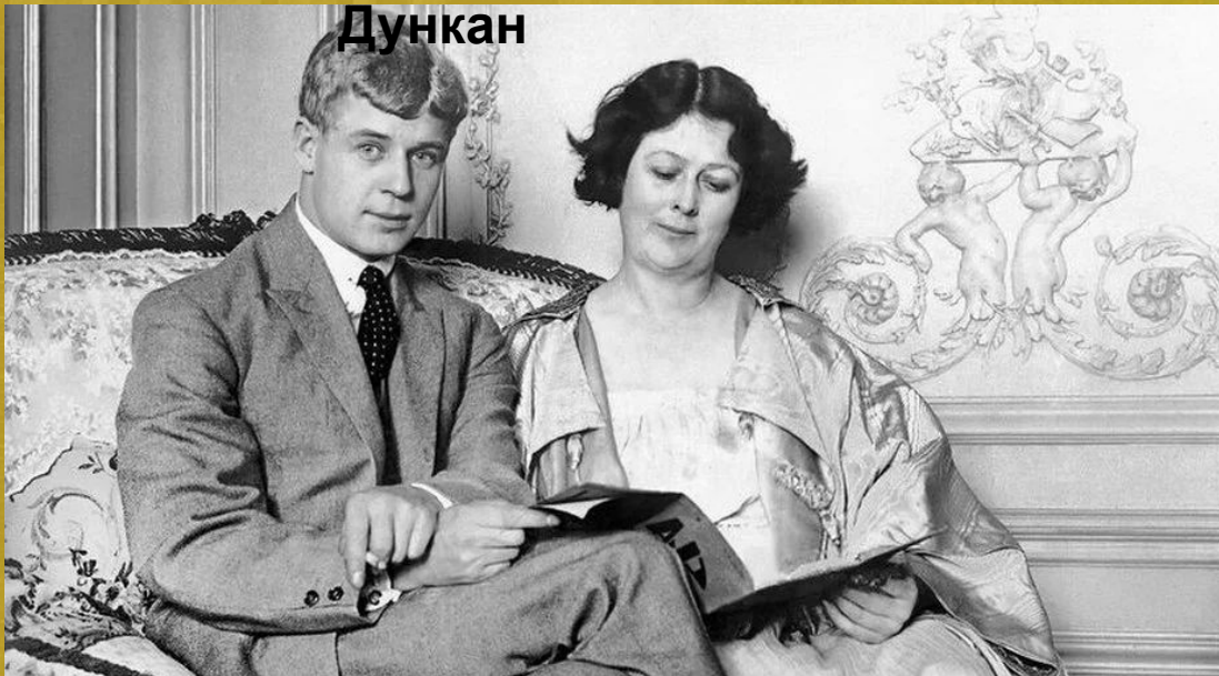
Есенин с Айседорой Дункан

После свадьбы с Дункан путешествовал по Европе, США. Их брак оказался краток – в 1923 году пара распалась, и Есенин вернулся в Москву.