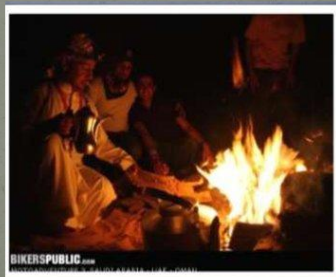
А чтобы ветер не задул пламя они обложили костёр кусками соды, которую везли на продажу.