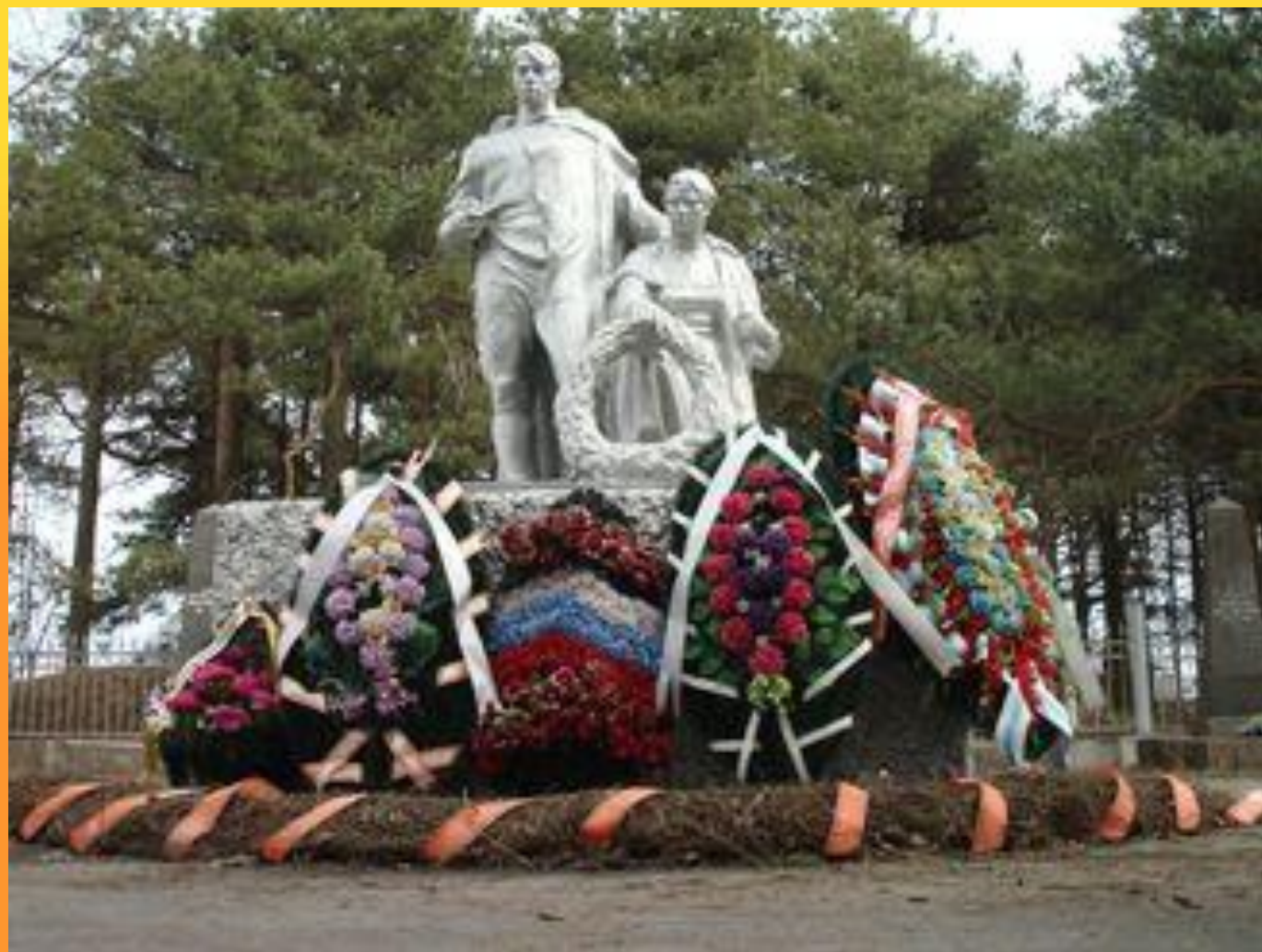
Мемориальное кладбище в посёлке Выползово