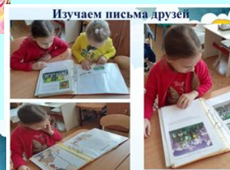
Изучаем письма друзей