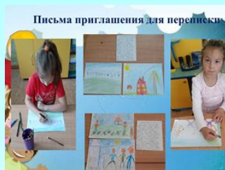
Письма приглашения для переписки