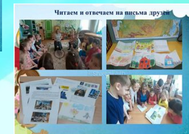
Читаем и отвечаем на письма друзей