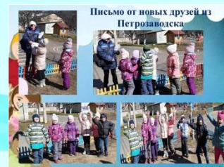
Письмо от новых друзей из Петрозаводска