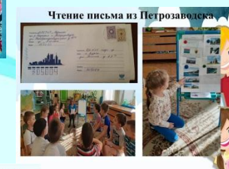
Чтение письма из Петрозаводска