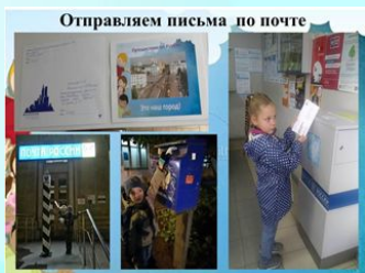
Отправляем письма по почте