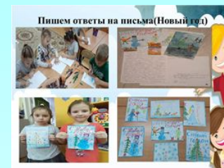
Пишем ответы на письма(Новый год)