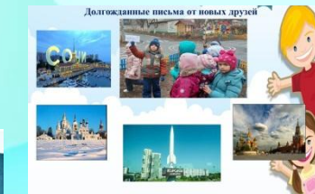
Долгажные письма от новых друзей