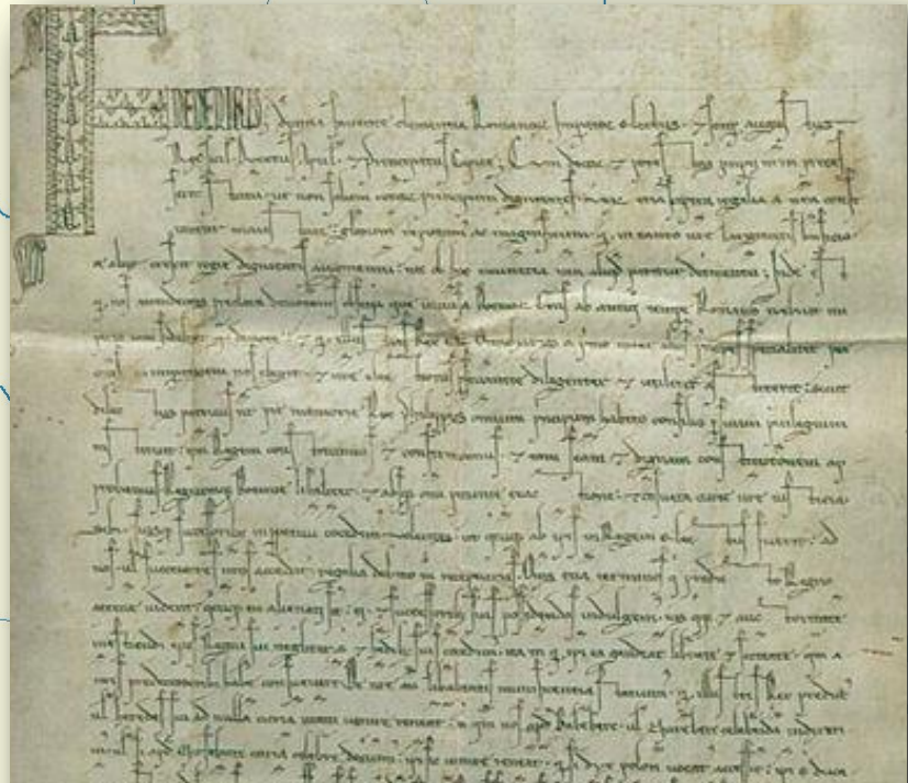
«Золотая сицилийская булла». регулировала положение чешского короля