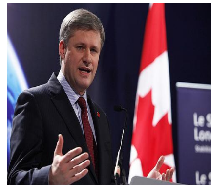
Премьер- министр Стивен Харпер