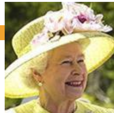
Глава государства королева Елизавета II.