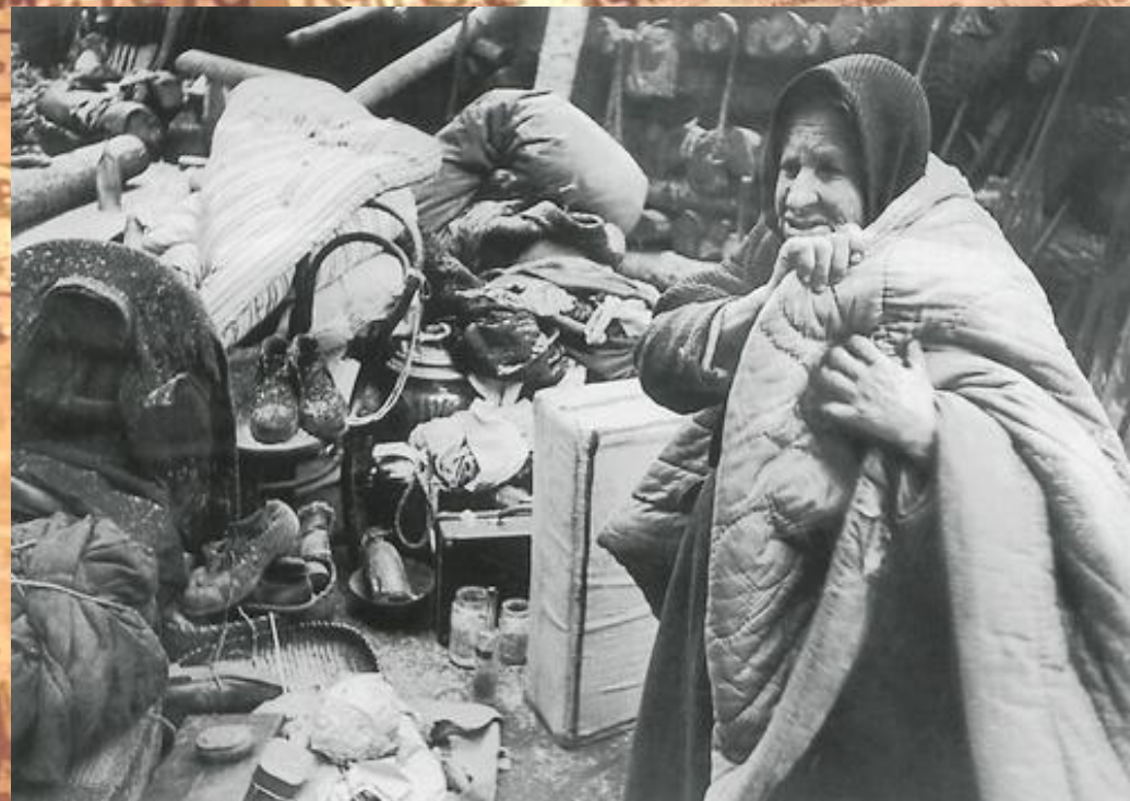
Утром после бомбардировки, 14 октября 1941 г.

В годы блокады в Ленинграде работали порядка 50 фотокорреспондентов, которые имели специальное разрешение на съемку. Большинство из них снимали рабочих на заводах, солдат, уходящих на фронт, лица людей, преисполненных отваги и ненависти к врагу, руины города.