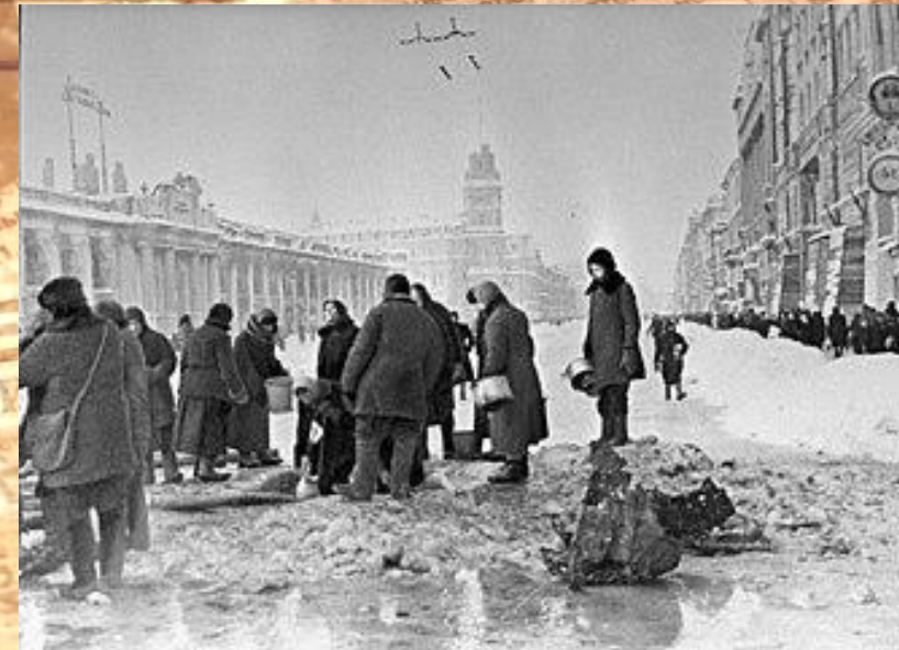
Жители блокадного Ленинграда набирают воду, появившуюся после артобстрела в пробоинах в асфальте на Невском проспекте, фото Б. П. Кудоярова, декабрь 1941

За всю историю человечества это самая длительная и страшная осада города. Историки насчитывают от 800 тысяч до 1 миллиона человек умерших от голода за период блокады. В блокадном кольце, вместе с беженцами и жителями пригородных районов, оказалось около 3,4 миллиона человек.