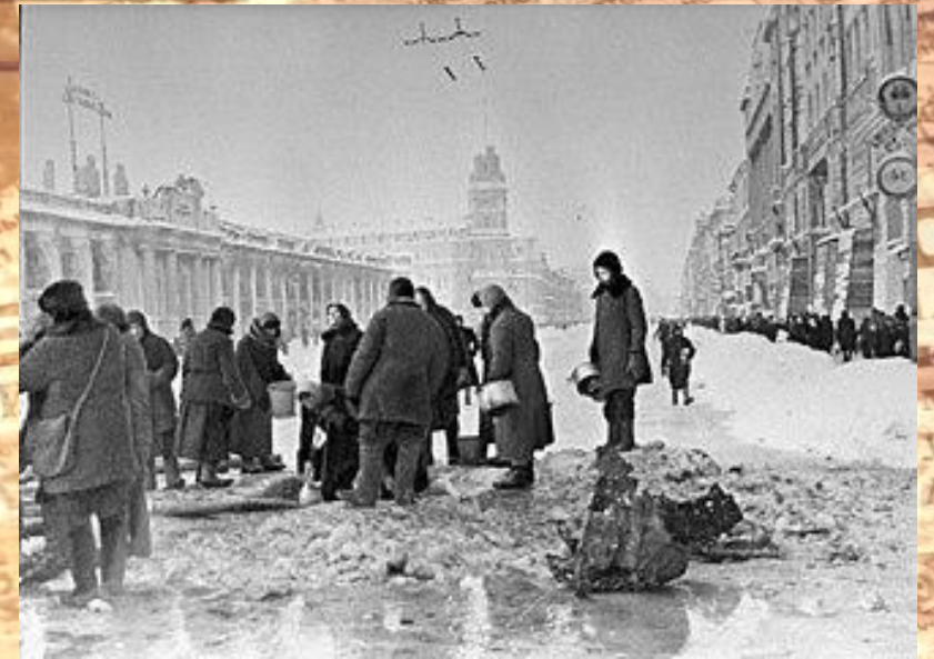
Жители блокадного Ленинграда набирают воду, появившуюся после артобстрела в пробоинах в асфальте на Невском проспекте, фото Б. П. Кудоярова, декабрь 1941

За всю историю человечества это самая длительная и страшная осада города. Историки насчитывают от 800 тысяч до 1 миллиона человек умерших от голода за период блокады. В блокадном кольце, вместе с беженцами и жителями пригородных районов, оказалось около 3,4 миллиона человек.