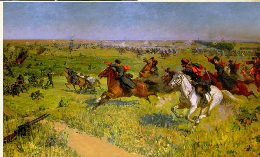
Сабельная атака казаков под Кущёвской