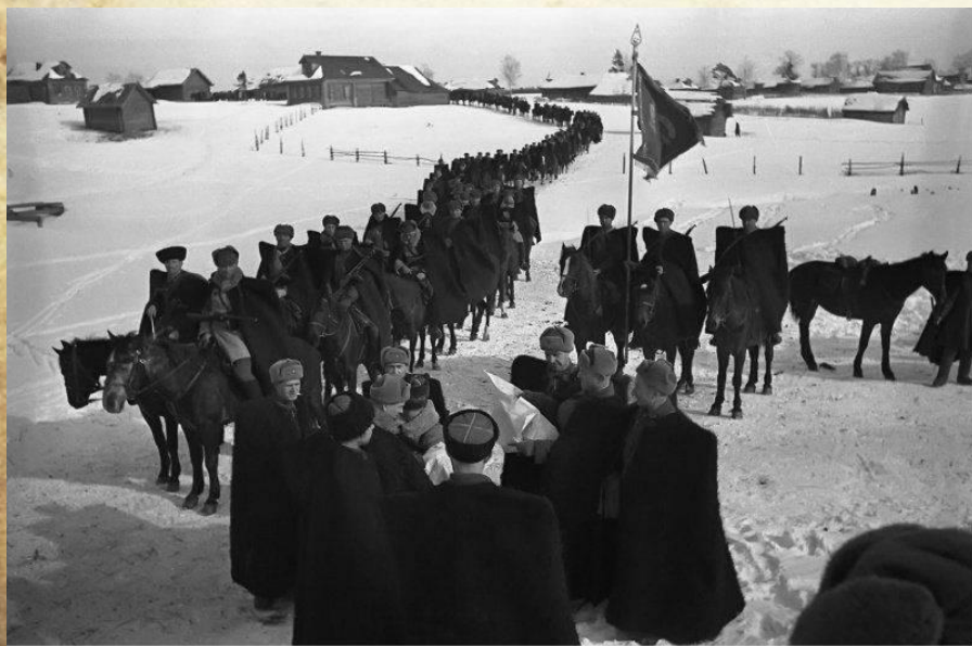
Генерал Доватор и его казаки