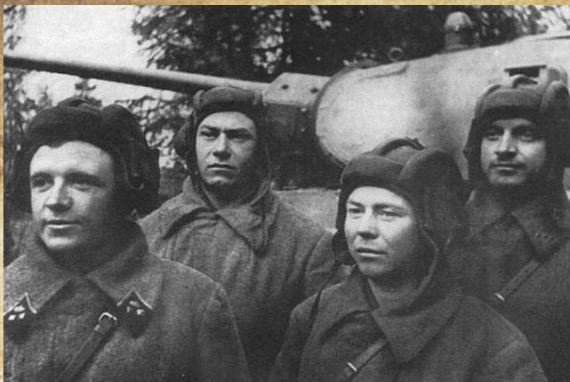
Экипаж танкового аса Дмитрия Лавриненко (крайний слева)