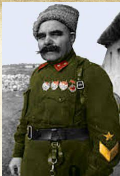
Генерал-лейтенант Шапкин Т.Т. на Сталинградском фронте