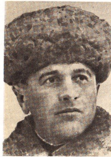
Доватор Л. М.

Казачьи части Л.М.Доватора вошли в тыл к гитлеровцам при отступлении вермахта под Москвой и нанесли тяжелый урон немецко-фашистским войскам. Казачьи дивизии принимали активное участие в схватках с частями вермахта на направлении Ростов-Краснодар.