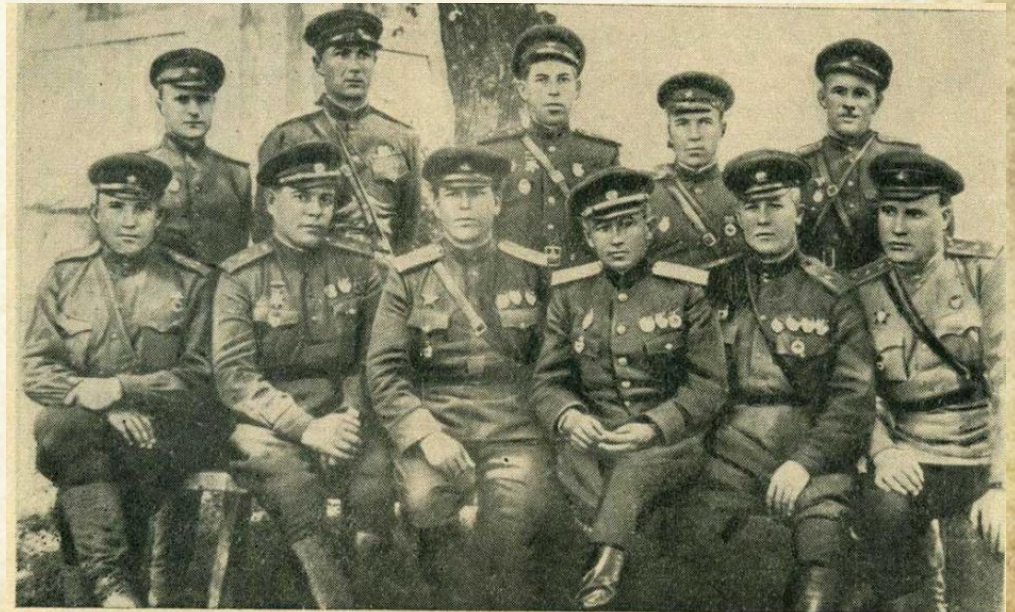
Руководящий состав 5-го гвардейского Донского казачьего кавалерийского корпуса.