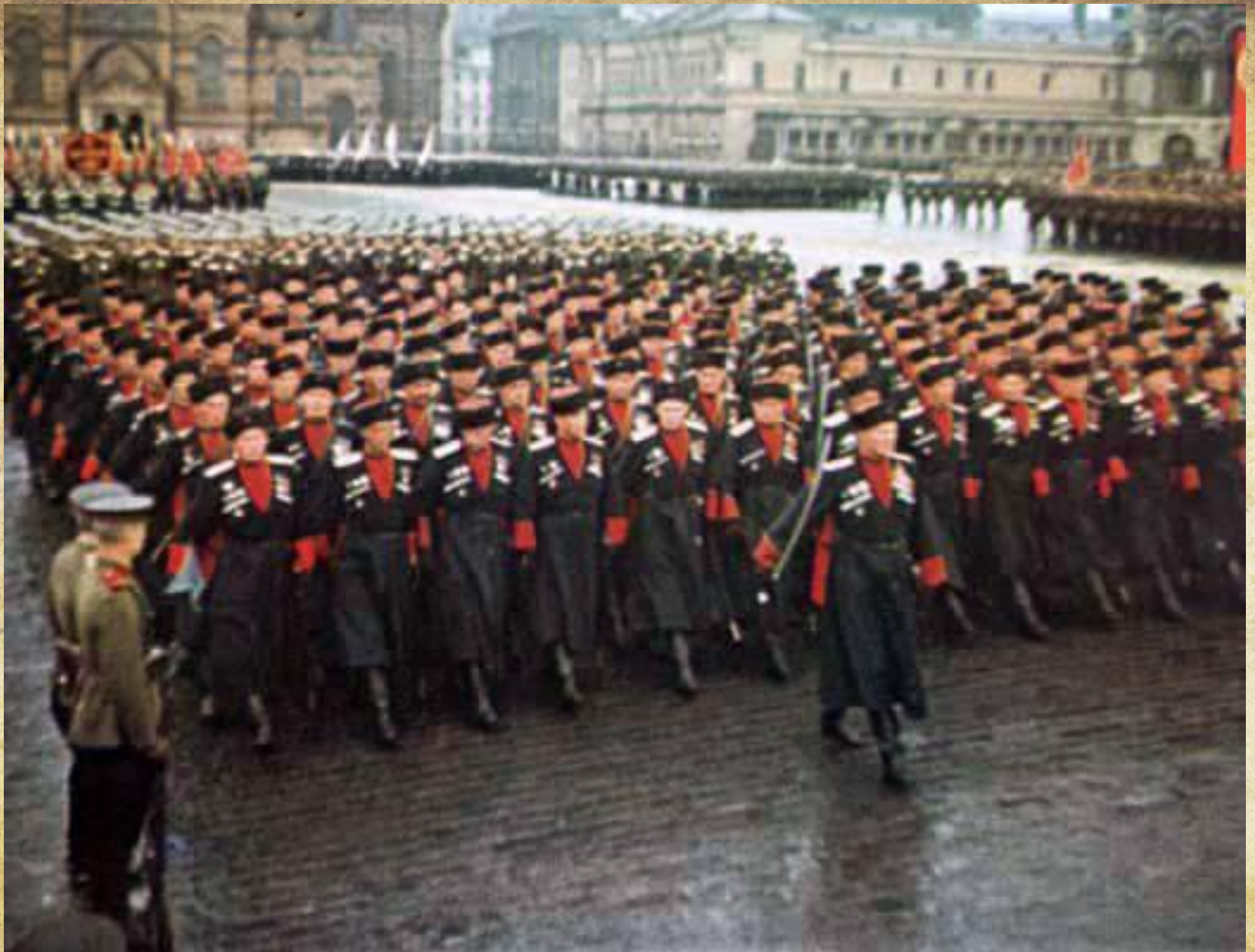
Казачи на Параде Победи 24 июня 1945 года