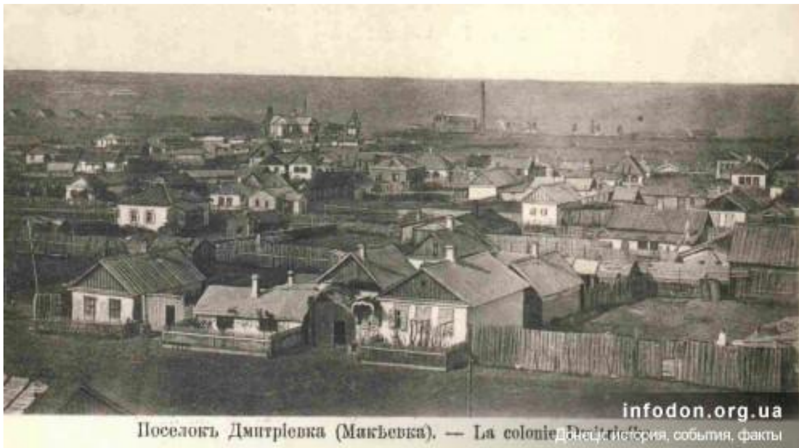
Поселокъ Дмитріевка (Макѣвка). — La colonie Донецька історія, события, факты

В 18 - 19 веках на территории современного Донецка возникли следующие поселения: Александровка, Крутояровка, Екатериновка, Алексеевка, Семёновка, Любимовка, Авдотьино и др.